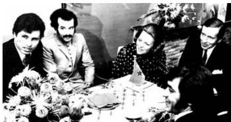
Koninklijk bezoek aan Amersfoort.

50 jaar Marokkaanse migratie. Rondreizende tentoonstelling in Archief Eemland en Bibliotheek Eemland, waaraan Amersfoortse verhalen, vraaggesprekken en voorwerpen zijn toegevoegd.