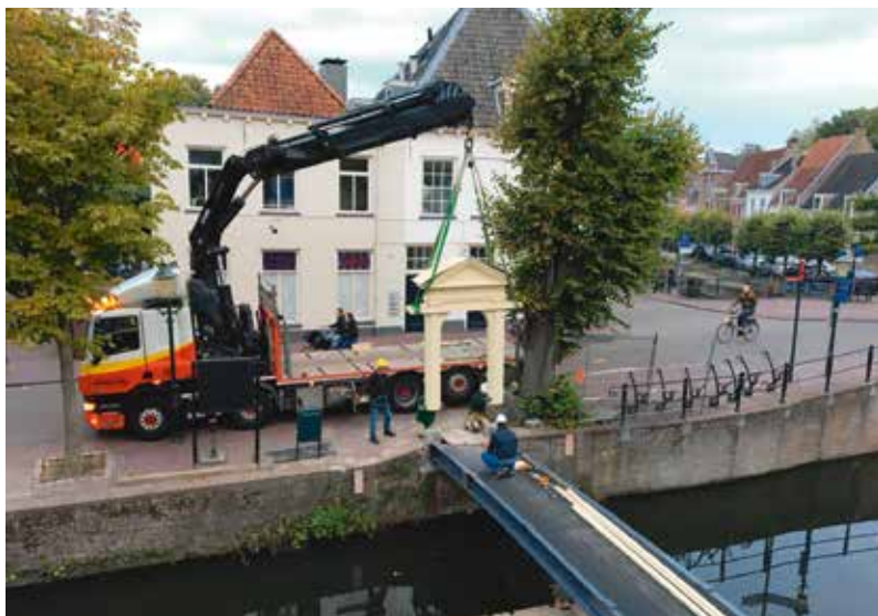
Herstel van de poort.

Alle zinken goten en regenpijpen zijn vervangen. Het aanwezige zink was niet overal op de juiste manier aangebracht en onvoldoende gesoldeerd. Hierdoor waren er