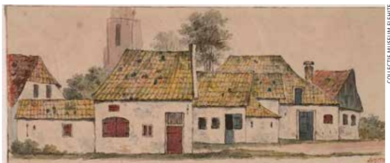
COLLECTIE MUSEUM FLEHITE

Dankzij de specifieke beschrijving van het huis met zijn uithangbord en de nauwkeurig beschreven woonhuizen in de Blaffert van het huisgeld (wij noemen dat nu onroerende zaakbelasting, de OZB) uit 1755 bleek de exacte locatie van het huis vast te stellen. We hebben zeventien transportaktes in een overzicht geplaatst en daarbij nauwkeurig de omschrijving van de objecten en