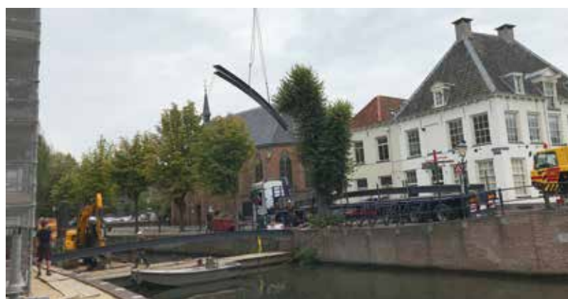
JOYCE DE LA CROIX

De prioriteit verschoof naar het museumgebouw: de drie muurhuizen aan de Breestraat hadden geen problemen, maar de in 1898 opgetrokken uitbouwen met de karakteristieke trapgevels waren losgescheurd. Hier en daar scheen het daglicht door de scheuren naar binnen. Om deze situatie te stabiliseren zijn op de begane grond een betonnen vloer en palen van 8 m lengte gestort. De uit-