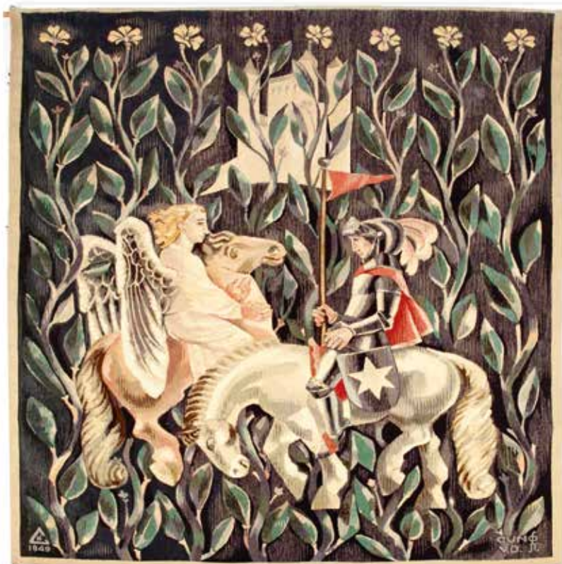
Het aangekochte wandtapijt, 148x122 cm.

De kunstnijveraar Edmond de Cneudt (Gent 1905-1987 Baarn) vestigde in 1937 zijn handweverij en tapijtknoperij in Huize Middelwijk in Soest. Een jaar later orga-