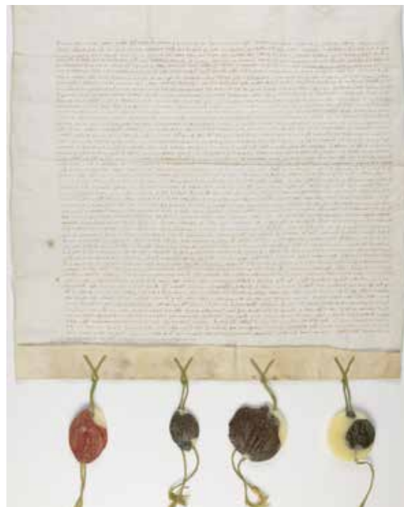
HET UTRECHTS ARCHIEF, BISSCHOPPEN VAN UTRECHT 141

en 1807 nog een portie bij, zodat er in het begin van de negentiende eeuw nog maar één 'particuliere' kanunnik was. Toen die in 1818 overleed ging zijn canonicaat over op de Sint-Joriskerk. Daarmee was de huidige verdeling van de opbrengst bereikt. Ondertussen was het dekenambt al sinds 1715 waargenomen door de zo geheten eerste Amersfoortse burgemeester.