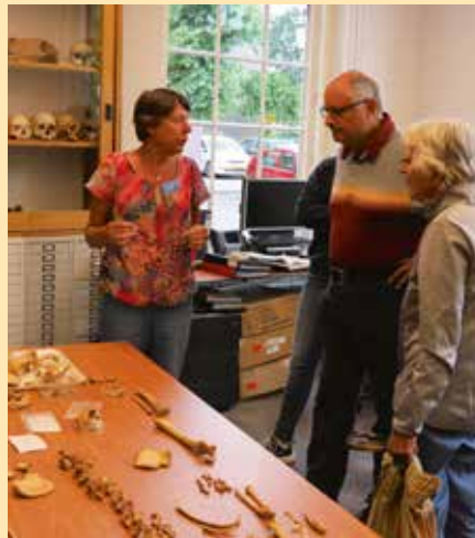
Uitleg over skeletonderzoek.