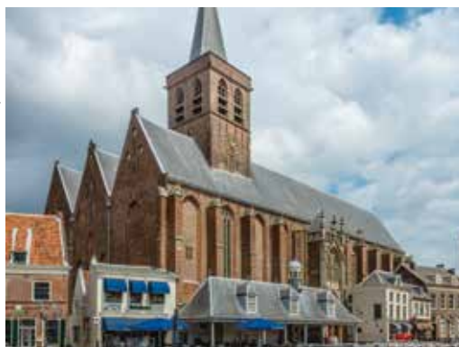
De Sint-Joriskerk, tot in 1579 zetel van het kapittel van Sint-Joris.