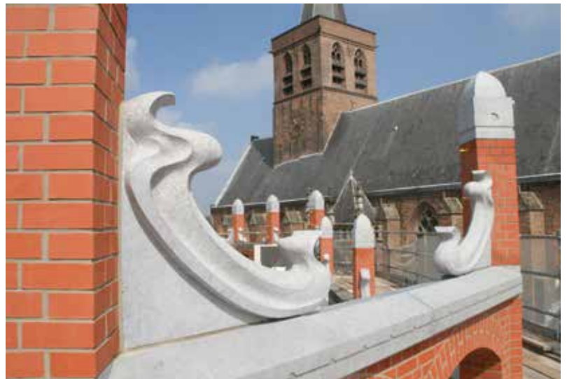
Het natuursteen met de kenmerkende Jugendstildetaillering