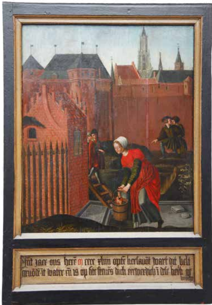
OUDE-KATHOLIEKE PAROCHIE H. GEORGIUS