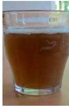
Het wassen, het vuile water, de achterkant.