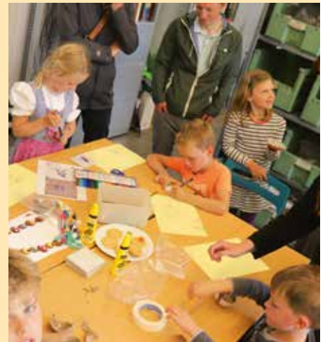
Aan de slag met scherven en tegels.