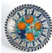
Schotel van majolica, herkomst onbekend, verblijfplaats Fries Museum Leeuwarden.