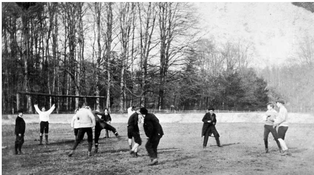
Een oefenpartijtje anno 1897, van Vitesse in Arnhem. Men speelde niet in sportkleding, maar gewoon in de dagelijkse kloffie; soms in een keurig kostuum, inclusief bolhoed. Het veld was niet voorzien van belijning, in het doel ontbrak een net.

foortsche cricketclubs 'Achilles' en 'Kracht en Vlugheid' zich op de Varkensmarkt, marcheerden, met het muziekcorps 'De Amersfoortsche Harmonie' aan 't hoofd, naar 't station ter ontvangst der Utrechtsche cricketclub 'Hercules', die bij aankomst met muziek en gejuich werd begroet.' Vandaar ging het in een stoet naar het veld bij Oud-Leusden. Na afloop van de wedstrijd kreeg Hercules een medaille uitgereikt, omdat zij de wedstrijd hadden gewonnen. Ook reikten 'enkele jonge dames' van de plaatselijke tennisclub aan Achilles een vaandel uit. Na deze korte plechtigheid volgde een optocht naar de stad. Daar aangekomen wachtte de sportlieden nog een diner, waarna de leden van Achilles de sporters van Hercules 's avonds om negen uur naar het station brachten.