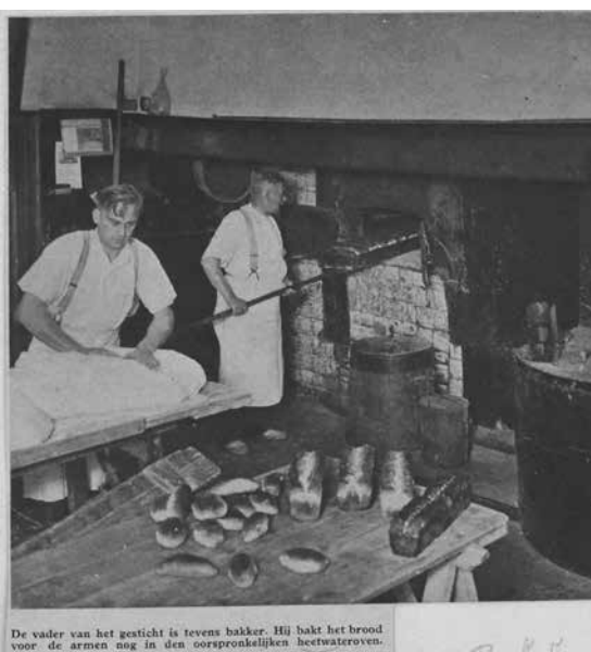
De vader van het gesticht is tevens bakker. Hij bakt het brood voor de armen nog in den oorspronkelijken heetwateroven.