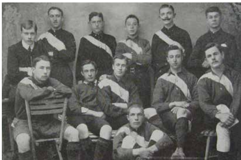
Het team van AFC Quick in het seizoen 1902-1903.

Toch was een sportwedstrijd meer dan een paar uurtjes onschuldig vermaak. Allerlei rituelen en gedragingen maakten het een gecompliceerde sociale uitwisseling tussen gelijkgezinden, waarbij goed gastheerschap heel