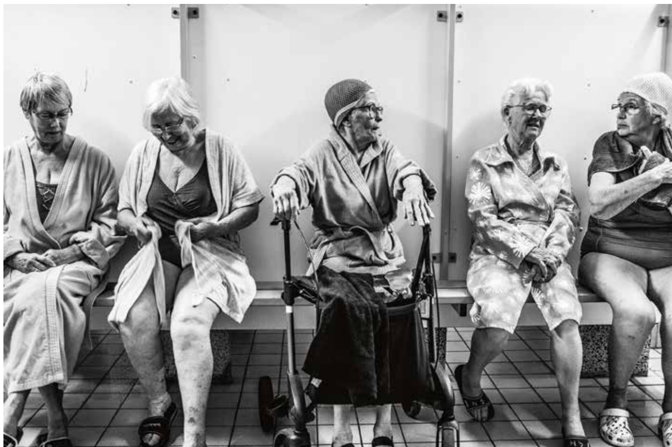
Synchroonzwemmen, de masters.