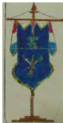
De banier van de schermvereniging Eendracht Maakt Macht Amersfoort, 1896.

Bovenal zetten de jongeren zich af tegen hun ouders, die van lichaamsbeweging helemaal niets moesten hebben. Achter een bal hollen was niet fatsoenlijk en deftig en dat waren eigenschappen die de ouders in overvloed hadden. 'Wat houdt de meeste mensen terug? Een microbe die bij ons te lande voorgoed zijn tenten schijnt te hebben opgeslagen, namelijk de deftigheid.