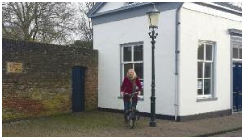
Het tolhuisje met de auteur en links de gevelsteen.

Aan de bochten in de singel kun je nog zien dat zich hier een bolwerk bevond. Het huisje moest, samen met een hekwerk, de gesloopte Bloemendalsebuitenpoort vervangen. Op het bord valt te lezen dat het huisje waarschijnlijk is ontworpen door J.D. Zocher jr., en gebouwd in de tijd dat het plantsoen werd aangelegd.