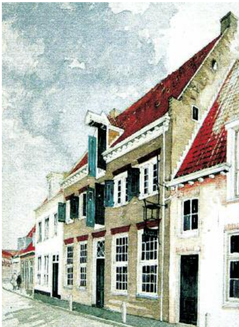
De Tabaksplant. Aquarel door Cor van den Braber.

Er is ook nog de associatie met de naam van het gebied: de Pothof. Deze naam heeft niets te maken met Armen de Poth of de Pothbroeders. De naam werd al in 1388 in een akte genoemd, toen de Pothbroeders nog niet bestonden. De Pothof was een leen van de bisschop van Utrecht aan de familie Van Nijvel, die het weer in achterleen aan de burgemeester had gegeven. Dit laatste betekende dat het in feite de stad was die er gebruik van maakte. In diverse archiefstukken komt de naam Pothof voor. Het was kennelijk een omvangrijk gebied, dat buiten de eerste stadsmuur lag. Vanaf eind 14e eeuw werd