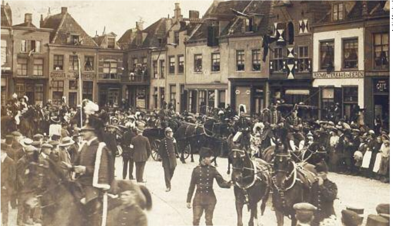
Boven: Optocht van cavaleristen op de Hof, 1913.