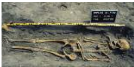
Centrum voor Archeologie

Sint-Bonifaciusstraat 61, elke zaterdag van 12.00-17.00 uur en op afspraak. 033 463 5661, www.wijkmuseum-soesterkwartier.nl