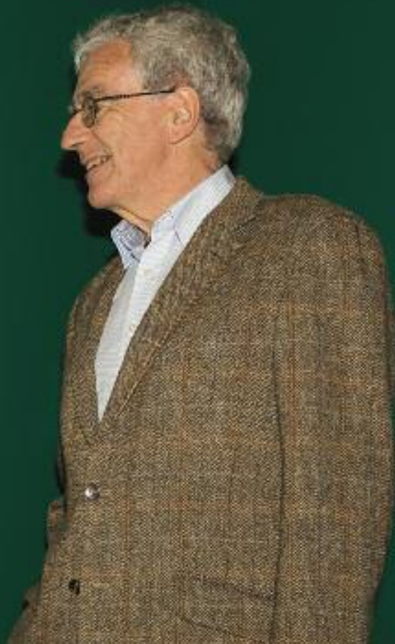
Ep de Ruiter/Museum Flehite

Mijn belangstelling voor de Eerste Wereldoorlog is altijd groot geweest. Samen met mijn echtgenote heb ik uitgebreide reizen gemaakt naar de slagvelden rondom Ieper in België en Verdun in Frankrijk. Nog altijd is het verbijsterend de plaatsen te zien waar zoveel jonge mannen gesneuveld zijn.