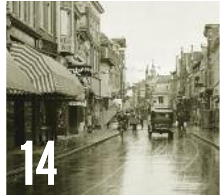
HERINNERINGEN VAN MIDDENSTANDERS