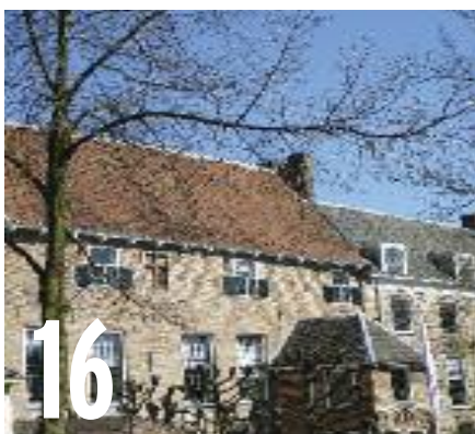
DE MUURHUIZEN ZIJN OUDER