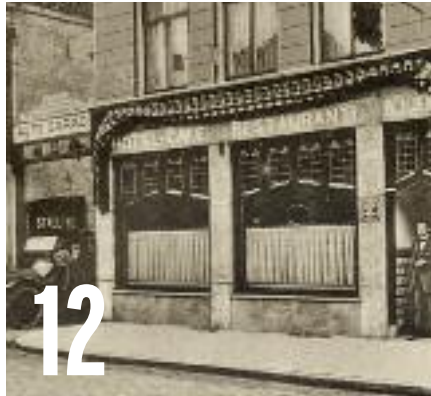
WINKELS IN BINNENSTAD