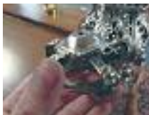
Siertorens vóór restauratie: het bovenstuk was niet origineel, veel tinsoldeer, ontbrekende bellen en dennenappels.

'Ook bij de restauratie van de rimoniem wilde ik de originele staat zoveel mogelijk benaderen. Als de sets over honderd jaar weer gerestaureerd worden, dan is niet specifiek te zien wat ik gedaan heb. En dat is goed.'