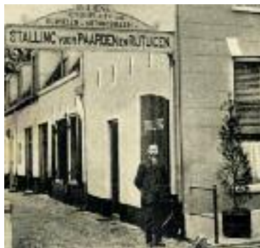
Links voorzichtig plaats voor automobielen; rechts vooral autogarage.

In het begin van de vorige eeuw waren er ook in de