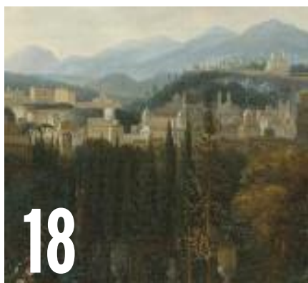
EEN NIEUWE WITHOOS