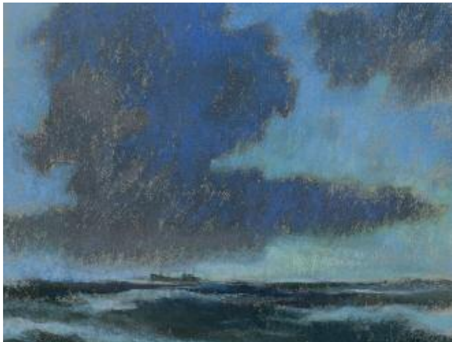
Ijmuiden, pastel, 1980.