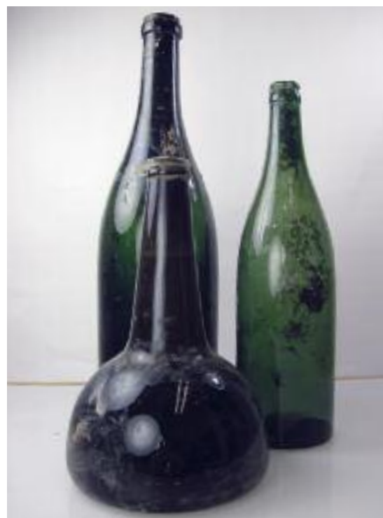
Centrum voor Archeologie

Wijnflessen en een champagnefles uit een beerput. Overzicht opgravings-terrein, met onder de Valkestraat en boven de Stovestraat.