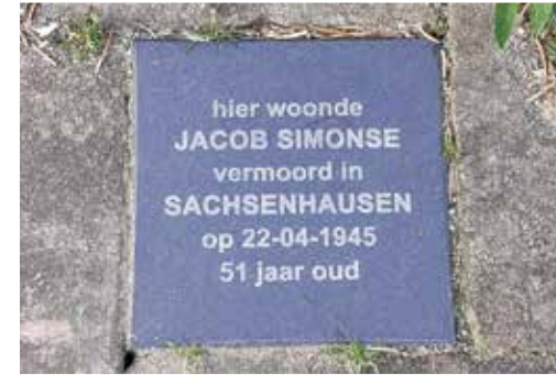
◀ De herdenkingsstenen op nummers 35, 22, en 12.

De verhalen verbinden de straat met de heftigste gebeurtenissen uit alle episoden van de wereldwijde oorlog in 1940-1945. Ze betreffen niet alleen slachtoffers. Er woonden ook helden in de straat, die onderduikers huisvestten of verzetsdaden pleegden. Soms waren zij naaste burens van bewoners die juist de kant van de bezetter kozen. Enkele bewoners hebben zich zelfs opgehouden aan weerskanten van de grens tussen goed en fout.