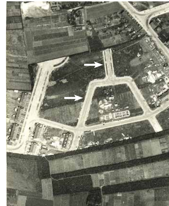
► Luchtfoto (detail), 1932. Een deel van de Celsiusstraat en omgeving in aanleg. Midden onder is het eerste huizenblok (nrs 37-41) zichtbaar dat voltooid was. Ook de Stepensonstraat (links) en de Lorentzstraat (horizontaal in beeld) zijn deels bebouwd.

aangelegd zouden worden bestond oorspronkelijk uit kleine akkers en weilanden, stukjes bos en eikenhakhout, met enkele boerderijen. Op oude kaarten is het te herkennen aan de begrenzing door de Leusderweg in het noordwesten en de Woestijgerweg in het oosten. Daar doorheen liep van noord naar zuid het Monnikenpad (de Buurtweg), de oude route tussen de stad en Leusden. Aan de zuidkant van de straat lag het landgoed Nimmerdor, met bos en duinen. De verbindingen in oost-westelijke richting, dus de Everard Meysterweg/Daltonstraat en de Bosweg, werden pas aangelegd nadat een groot deel van de woningen aan de Celsiusstraat en directe omgeving waren voltooid.