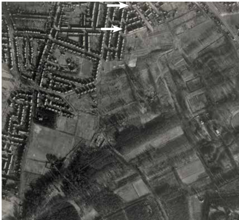
◀ Luchtfoto (detail) van de Allied Air Force (RAF), 3 februari 1945. Midden boven de Celsiusstraat en omgeving. Links, van boven naar beneden, de Leusderweg. Onder Zandbergen en Nimmerdor. DotKaData

In 1931 begon de bouw van het deel van het Leusderkwartier waarin de Celsiusstraat ligt. Aanvankelijk werd alleen het noordelijke gedeelte van het gebied bouwrijp gemaakt, dat wil zeggen de Lorentzstraat en de noordelijke delen van de Stephensonstraat, de Celsiusstraat en de Fahrenheitstraat. Vervolgens zijn in de Celsiusstraat tussen 1932 en 1937 blok voor blok de huizen vanaf de nummers 9 en 10 opgeleverd. Buiten die reeks vielen de nummers 37-43, die al in 1932 klaar waren, en de nummers 45 en 47 die pas in 1941 werden voltooid. De panden vlak bij de Everard Meysterweg, nummers 2-8, waren in 1935 klaar, de nummers 1-5 in 1938.