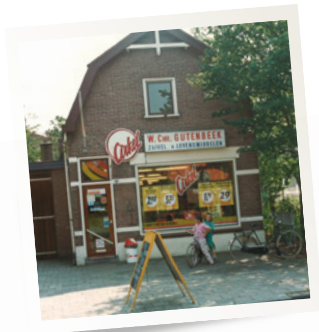
In de laatste fase was de buurtsuper van Gijtenbeek aangesloten bij Cirkel.

Vanuit mijn keuken heb ik elke dag zicht op de oude winkel. Nee, dat doet me niks meer. Maar als het pand op een dag zou worden afgebroken en helemaal wèg zou zijn, dat zou heel vreemd aanvoelen...'