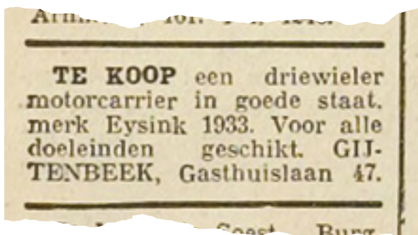
Een advertentie uit het Amersfoorts Dagblad van 28 augustus 1934.