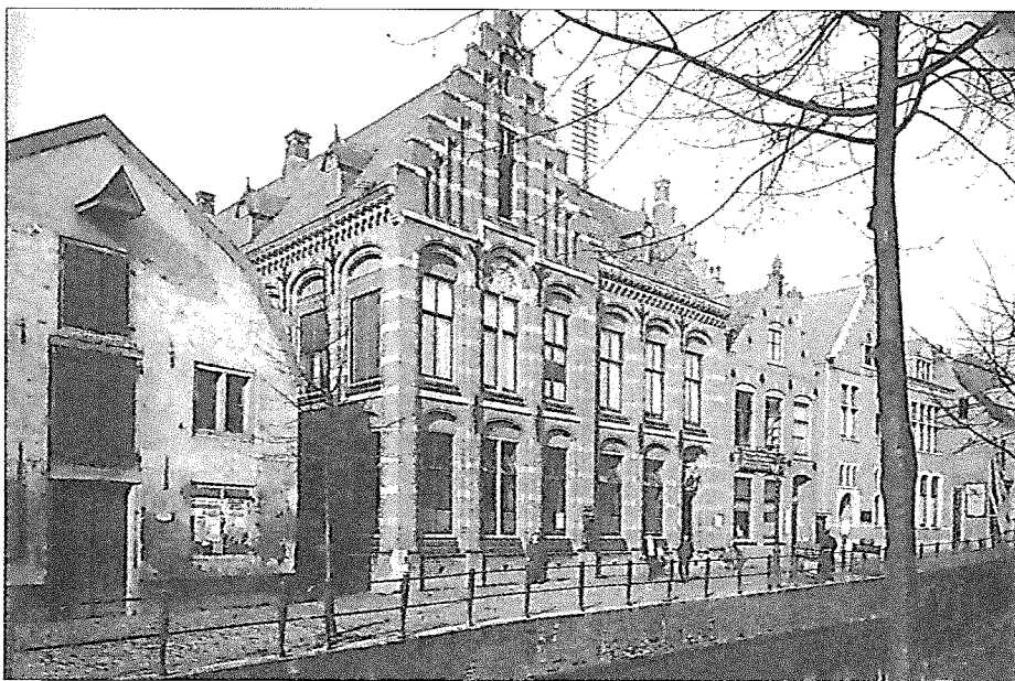
Het postkantoor aan de Kortegracht met rechts ervan de dienstwoning van de directeur.