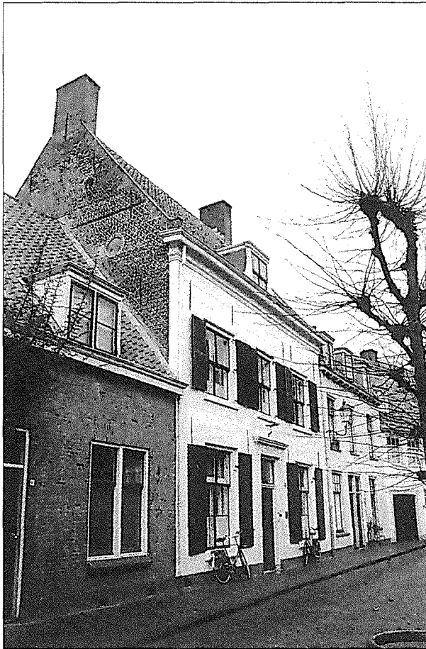
Breestraal 58 en buurpan- den.