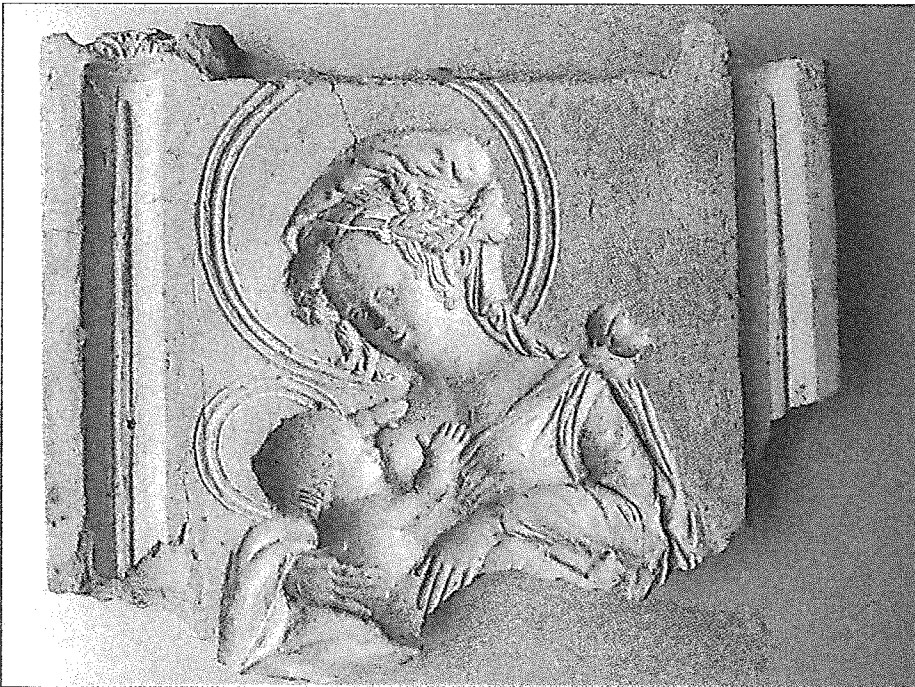
Opgraving nr. 26

De variëteit van de voorstellingen past in het landelijk beeld: op de eerste plaats afbeeldingen van Christus, dan van Maria en tenslotte de overige heiligen. Curieus is overigens het ontbreken van de heilige Agatha en de heilige Agnes die beiden toch sterk in de belangstelling hebben gestaan. Aan alle twee was in Amersfoort een klooster gewijd: Sint-Agnieten en Sint-Aagten. Misschien dat we hen bij komende opgravingen aan onze verzameling mogen toevoegen.