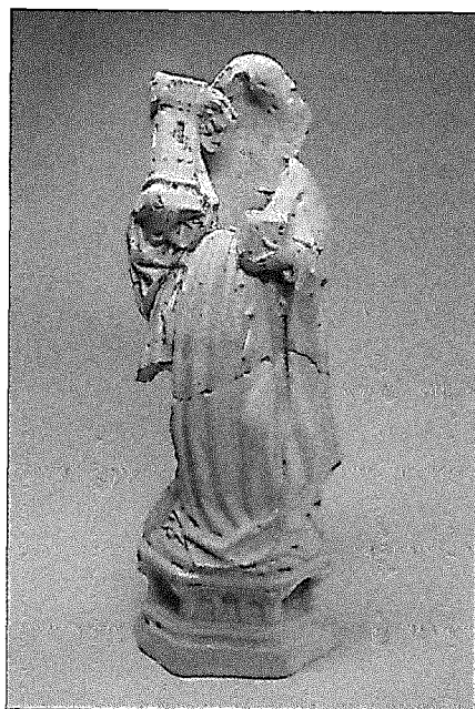
Opgraving nr. 8.