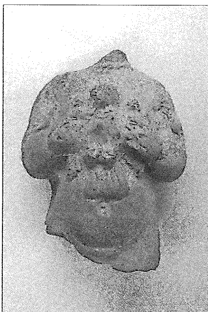
Opgraving nr. 22.