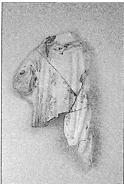
Opgraving nr. 11.