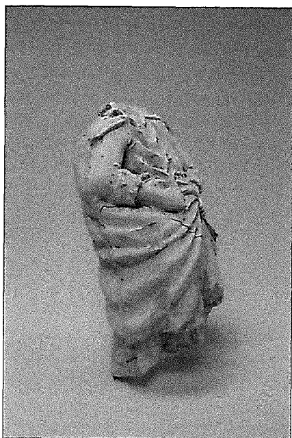
Opgraving nr. 27.