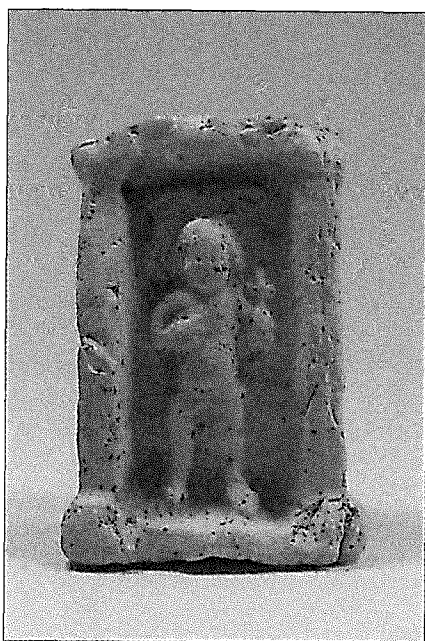
Opgraving nr. 20.