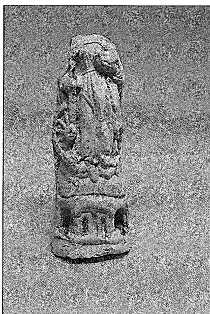
Opgraving nr. 4.