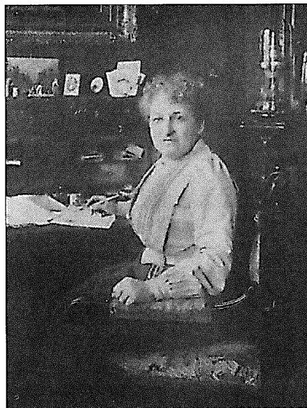
Carel Victor Gerritsen en zijn vrouw Aletta Jacobs. Illustraties uit Aletta Jacobs. Herinneringen.