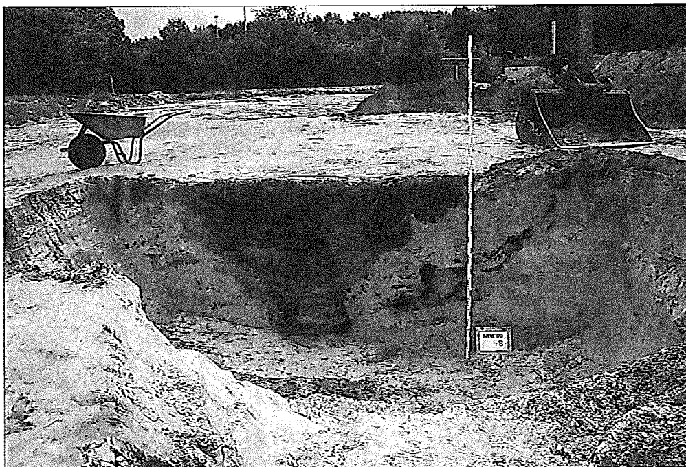
Een van de vele waterputten van het verdwenen dorp bij Nimmerdor.

Nimmerdor De voetbalvelden van sportpark Nimmerdor moesten plaatsmaken voor een nieuwbouwwijk, vanwege de nabijheid van Oud-Leusden een archeologisch interessante locatie. Waar nu enkel nog de toren van de kerk van Oud-Leusden staat, lag in de Middeleeuwen de toen belangrijke nederzetting Lisiduna. In de bekende oorkonde uit 777, waarin Karel de Grote goederen schenkt aan de bisschop van Utrecht, is sprake van een 'villa Lisiduna', een domein dat een centrale rol in deze streken speelde. De nederzetting bestaat dan al enkele eeuwen, want bij opgravingen voorafgaand aan de aanleg van de A28, begin jaren '80, is een grafveld gevonden, waarin de oudste graven dateren van circa 500.