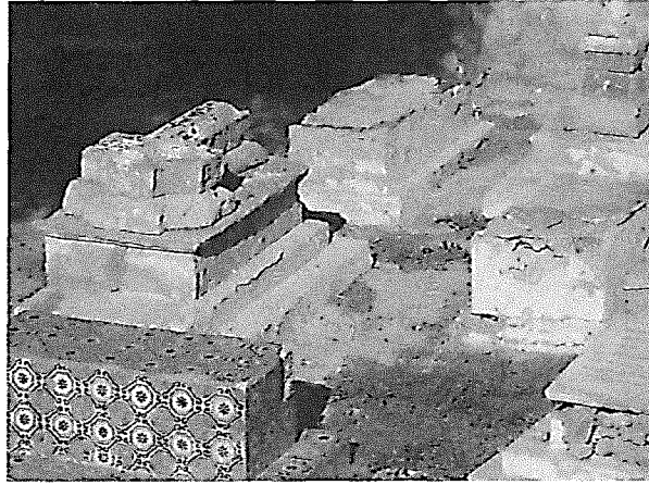
← ← Toegang tot de begraafplaats van Tripoli