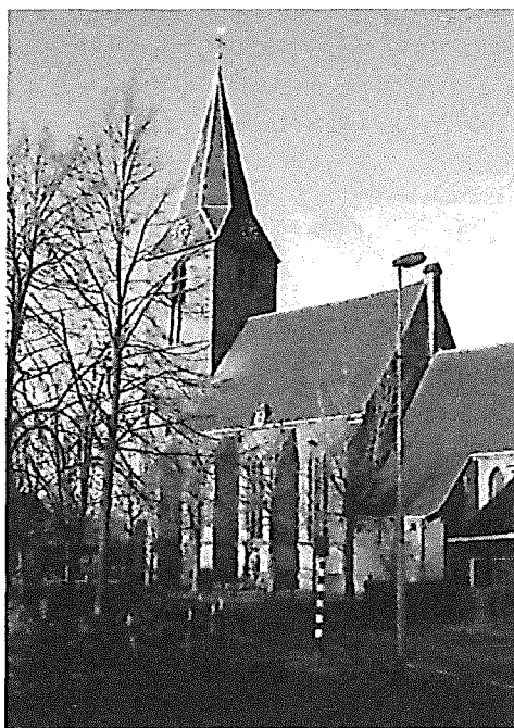
Hervormde kerk in Olst