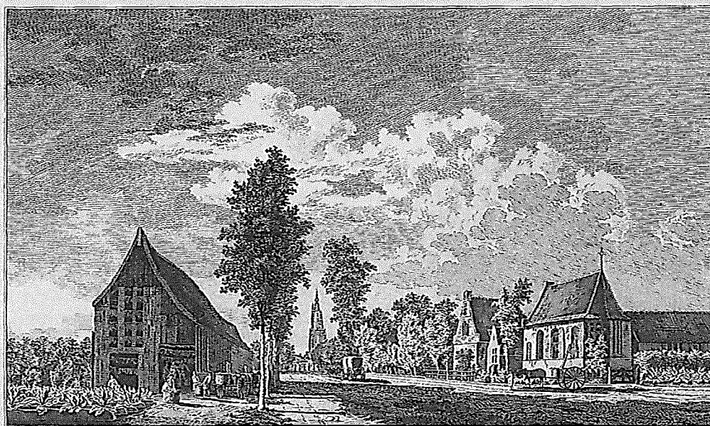
Tabaksplanterijen aan de hoge Weg by't Lazarushuis buiten Amersfoort. 1759.

Tabaksschuur en -veld aan de Hogeweg in Amersfoort. In de schuur hangen bladeren te drogen. Ook is te zien hoe de oogst in manden wordt gepakt en op een wagen geladen. Gravure van Paulus van Liender, 1759. Collectie Museum Flehite.