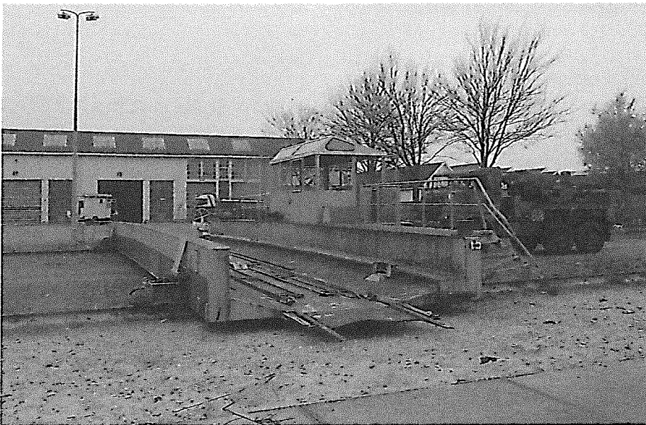
Wagenwerkplaats; rolbaan waarmee wagens konden worden verplaatst naar een ander werkplaatsspoor