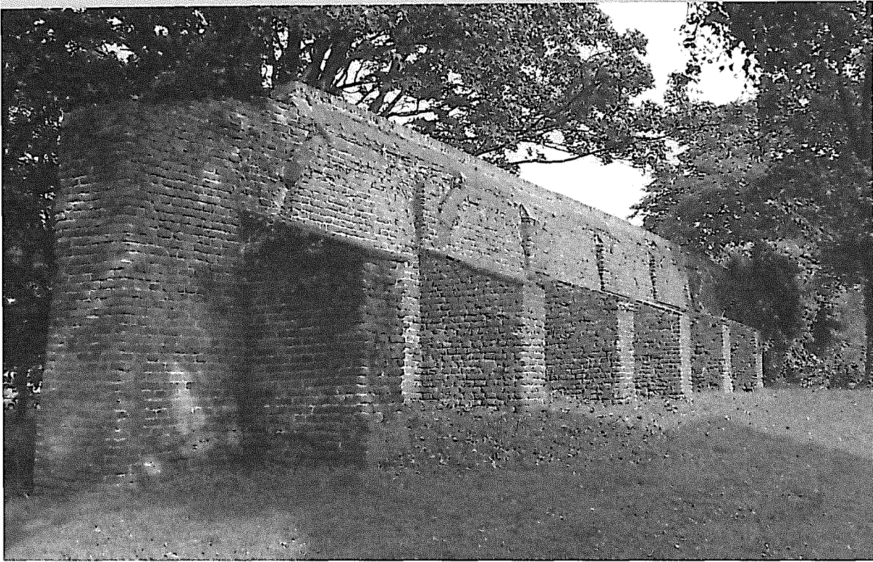
Stadsmuur aan de Sint Annastraat

en 1570 aan de stadszijde een aarden wal tegen de muur opgeworpen met een hoogte tot aan de weergang. Ondanks de aarden wal kon de stadsmuur de toenemende vuurkracht al gauw niet meer weerstaan. In de loop van de 17 e en 18 e eeuw raakte de muur dan ook in verval. In deze periode begon men de stadswallen en bastions te beplanten en werden er al wandelpaden aangelegd. In de 19 e eeuw had de ommuring haar militaire betekenis geheel verloren en werd gestart met de sloop. Door ingrijpen van Koning Willem II, werd behalve de poorten ook dit deel van de stadsmuur gespaard.