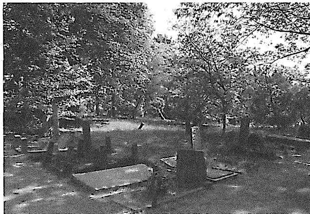
Algemene Begraafplaats Soesterweg

De begraafplaats is sinds 2000 aangewezen als rijksmonument, wat het bijzondere karakter ervan onderstreept. Sedert jaren is er echter sprake van verval van de graven. Omdat er dus al 75 jaar niet meer begraven en alleen nog incidenteel wordt bijgezet, worden er geen baten gegereneerd voor onderhoud van de gehele begraaf-