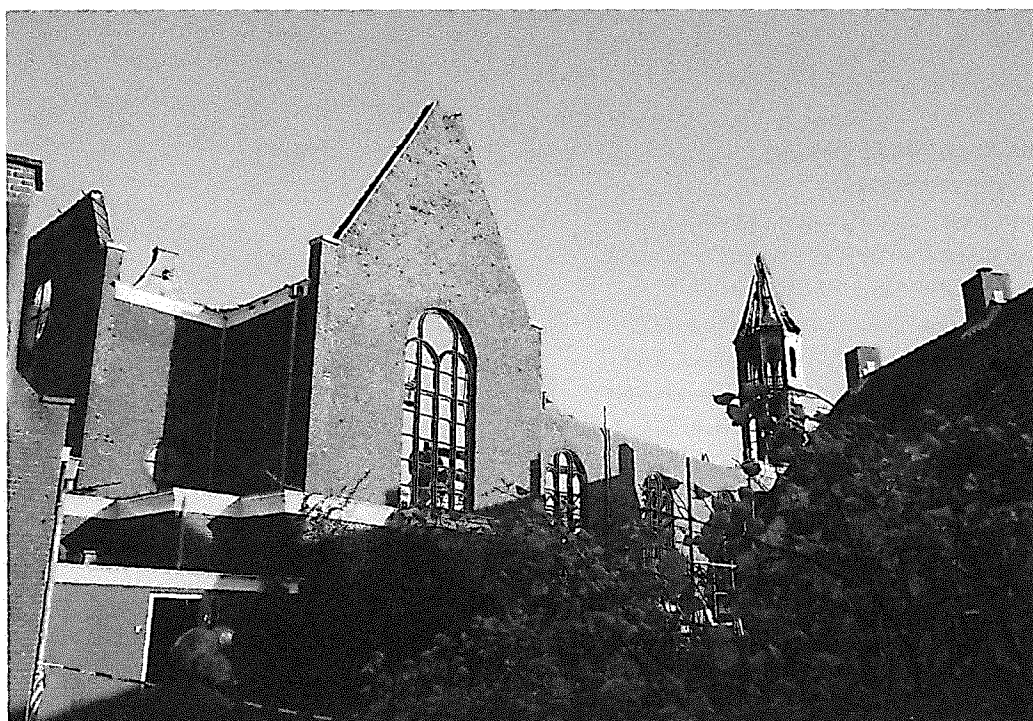
Elleboogkerk na de brand