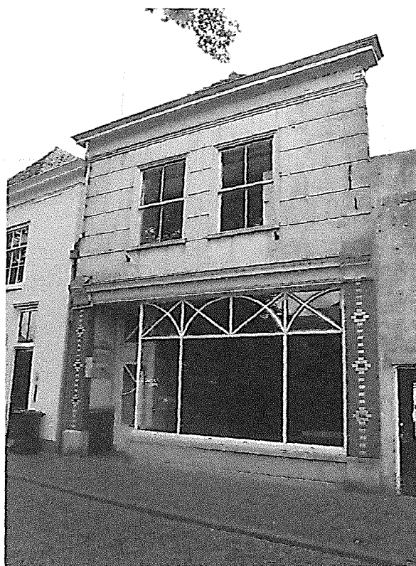
↑ Voorgevel Havik 37

Dit pand werd onlangs aangekocht door de NV Stadsherstel met als doel restauratie en verbouw tot winkel- en wooneenheden. Bij onderzoek bleek het een bijzonder rijksmonument. Achter