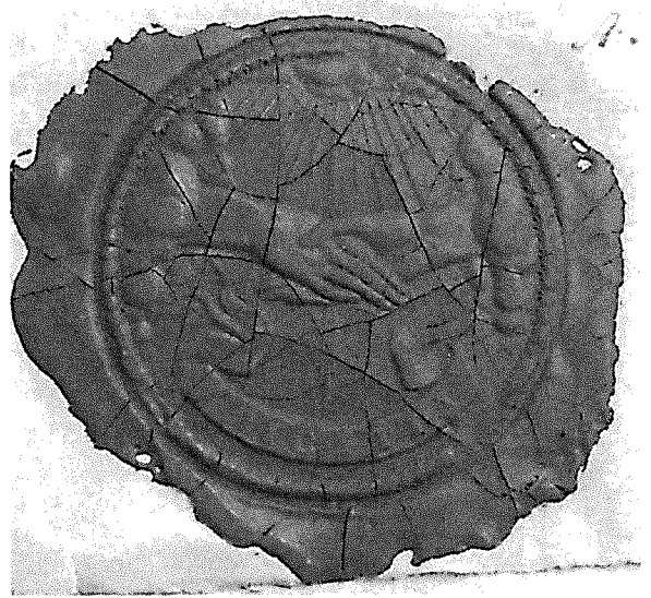
Zegels van de Sint-Joriskerk (Museum Flehite, resp. Td 50, 1921-004 en Ib 21).