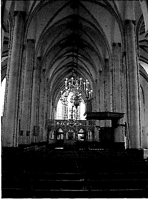
Het interieur van de Sint-Joriskerk naar het koor in het oosten. De kansel dateert van 1659, maar de voorganger zal op dezelfde plaats hebben gezeten. Het doophek is gebouwd in 1674.