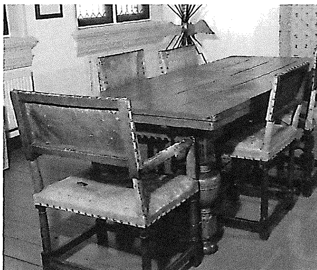
Tafel en stoelen afkomstig uit de chirurgiekskamer van de Sint-Joriskerk (Museum Flehite Td 25)

Ook meervoudig ouderling Dirk Camp is niet altijd even correct. In 1637 wordt hij meermaals ter vergadering geroepen, maar komt niet opdagen. Mede door zijn gedrag besluit de kerkenraad daarna een boete in te stellen voor laatkomers en wegblijvers zonder goede redenen. 16 Afgezien van een boete heeft zijn gedrag geen gevolgen. Hij wordt in de volgende jaren meermalen afgevaardigd naar de classis.