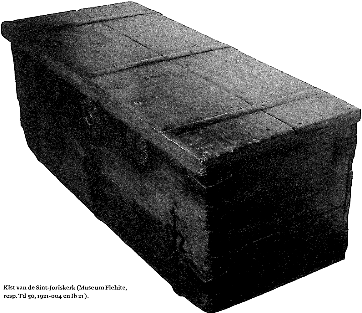
Kist van de Sint-Joriskerk (Museum Flehite, resp. Td 50, 1921-004 en Ib 21).