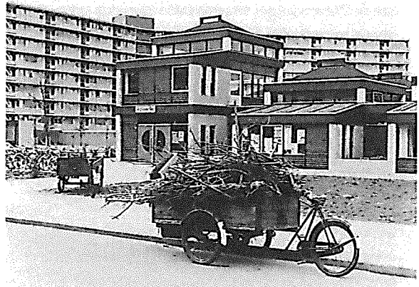
De Groene Stee in 1979 (Archief Eemland)

Ondanks of misschien wel dankzij de democratische opzet, traden er al spoedig onderhuidse spanningen op binnen de organisatie. Opbouwwerksters en wijkbewoners verschilden van opvatting over wat Liendert Leefbaar was of moest zijn.