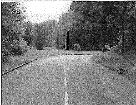
De doodlopende Weg van de Vrijheid (let op het verkeersbord!) bij de kruising met de Lageweg. In de verte zie je het drukke verkeer van de Hogeweg.

Achteraf gezien wel een beetje begrijpelijk. We konden heel fel zijn, hoewel we altijd probeerden 'on speaking terms' te blijven. Dat betekent ook, dat je moet kunnen inleveren. Je streeft naar 100 %, maar met 80 % ben je ook blij. Zelfs met 60 % heb je nog altijd meer bereikt dan niets."