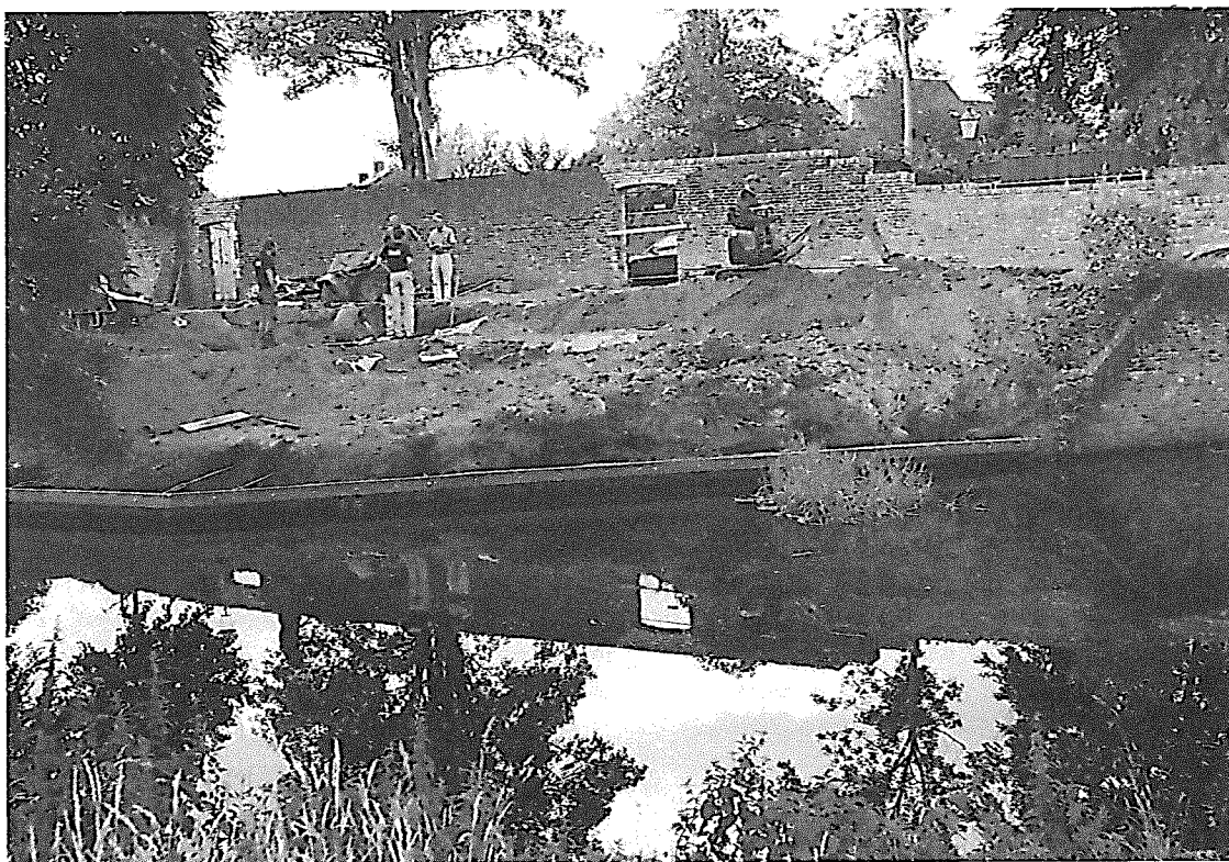
De Joodse begraafplaats bij de Bloemendalse-buitenpoort: zicht op het Zocherplantsoen waar het onderzoek aan de Portugees-joodse begraafplaats plaatsvond.

eeuw, ten tijde van de Inquisitie en Reconquista, het Iberisch Schiereiland waren ontvlucht. Kort na hun vestiging in de stad verwierven zij het eigendom van het terrein aan de oostzijde van het bastion en richtten dit in om er hun doden te begraven. De westzijde van het bastion is later, rond 1700, door Hoogduitse joden van de tweede immigratiegolf als begraafplaats in gebruik genomen en is nog altijd aanwezig. De oude Sefardische begraafplaats aan de oostzijde zou tot 1727 dienst hebben gedaan en daarna buiten gebruik zijn geraakt. De vraag blijft wat er na het buiten gebruik raken van de Sefardische begraafplaats is gebeurd. Op het terrein zelf herinnerde niets meer aan de begraafplaats en velen nemen aan, dat de graven met zerk en al zijn verplaatst. Hiervoor ontbreken echter alle bewijzen.