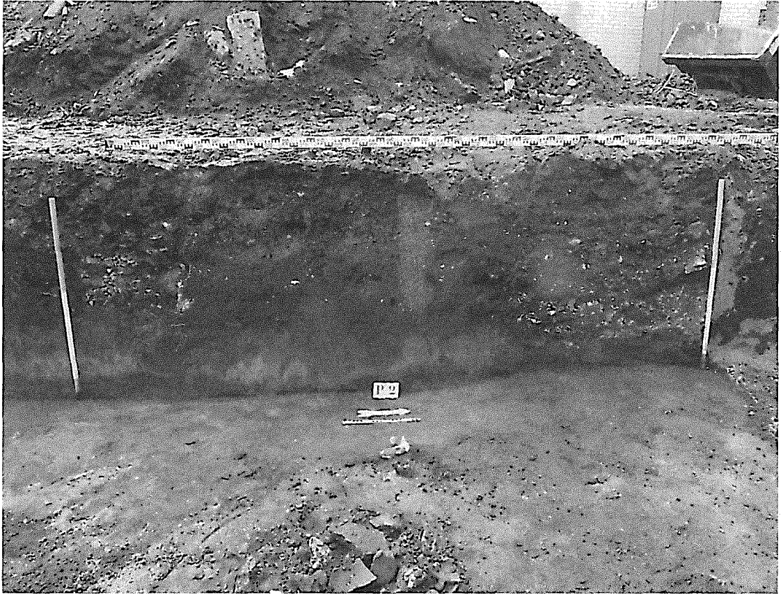
De lichtgrijze laag, het oude leefniveau, is nog zichtbaar in het profiel tijdens de opgraving.

Stedelijk agrarisch (15 e -16 e eeuw) en Stedelijke bebouwing (17 e -20 e eeuw).