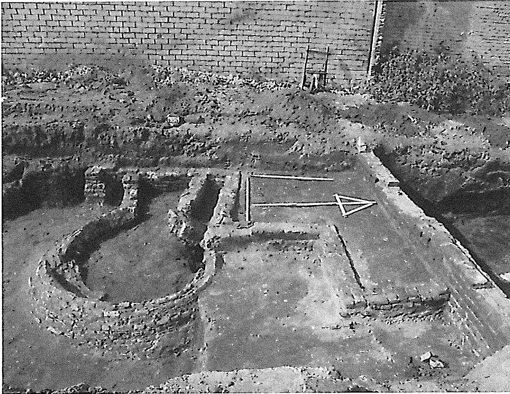
De enorme waterput wordt uitgegraven bij de opgraving Achter de Kamp.

tie tot de straatzijde, dus de bebouwing gelegen aan de Kamp en Achter de Kamp. Het open terrein dat tussen de bebouwing in ligt, de achterterreinen vanuit beide straten – Kamp en Achter de Kamp – gezien, is door de eeuwen heen gebruikt om diverse (afval)kuilen voor o.a. huisafval te graven, waterputten te slaan en een beerput te bouwen. De buitenkant van de beerput was met een laag klei bekleed, die er voor zorgde dat de inhoud van de beerput in de put bleef en niet de omliggende grond zou vervuilen. De put wordt dankzij vondsten in de 17 e eeuw gedateerd. Een andere interessante vondst was een goed geconserveerde mestkuil, waarin een vrijwel complete steengoed kruik is gevonden. De kruik dateert uit het einde van de 16 e eeuw en geeft daarmee een datering voor de mestkuil. Tevens zijn vier runderbegravingen aangetroffen, uit de 15 e en 16 e eeuw. De aan-