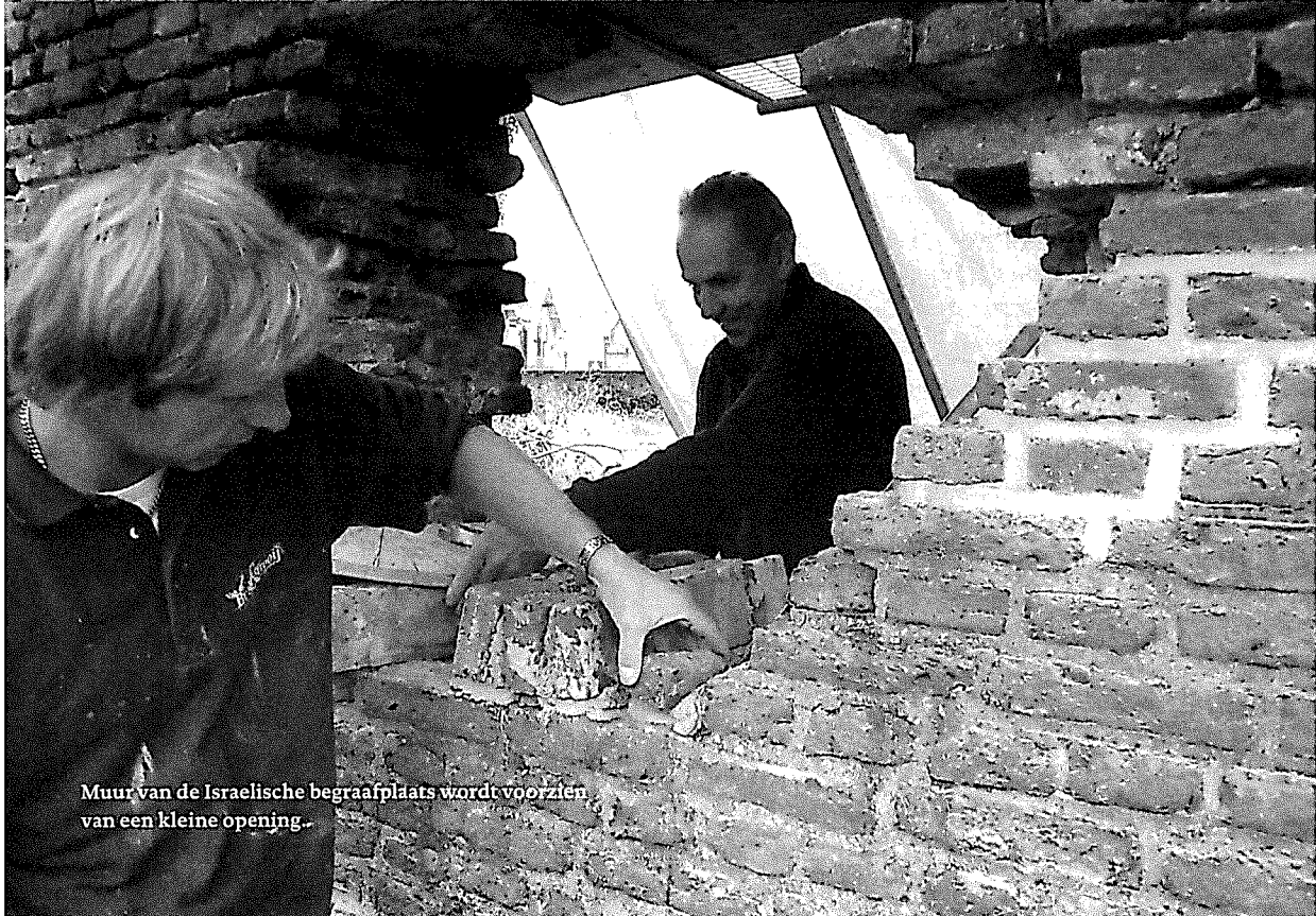
Muur van de Israëlische begraafplaats wordt voorzien van een kleine opening.