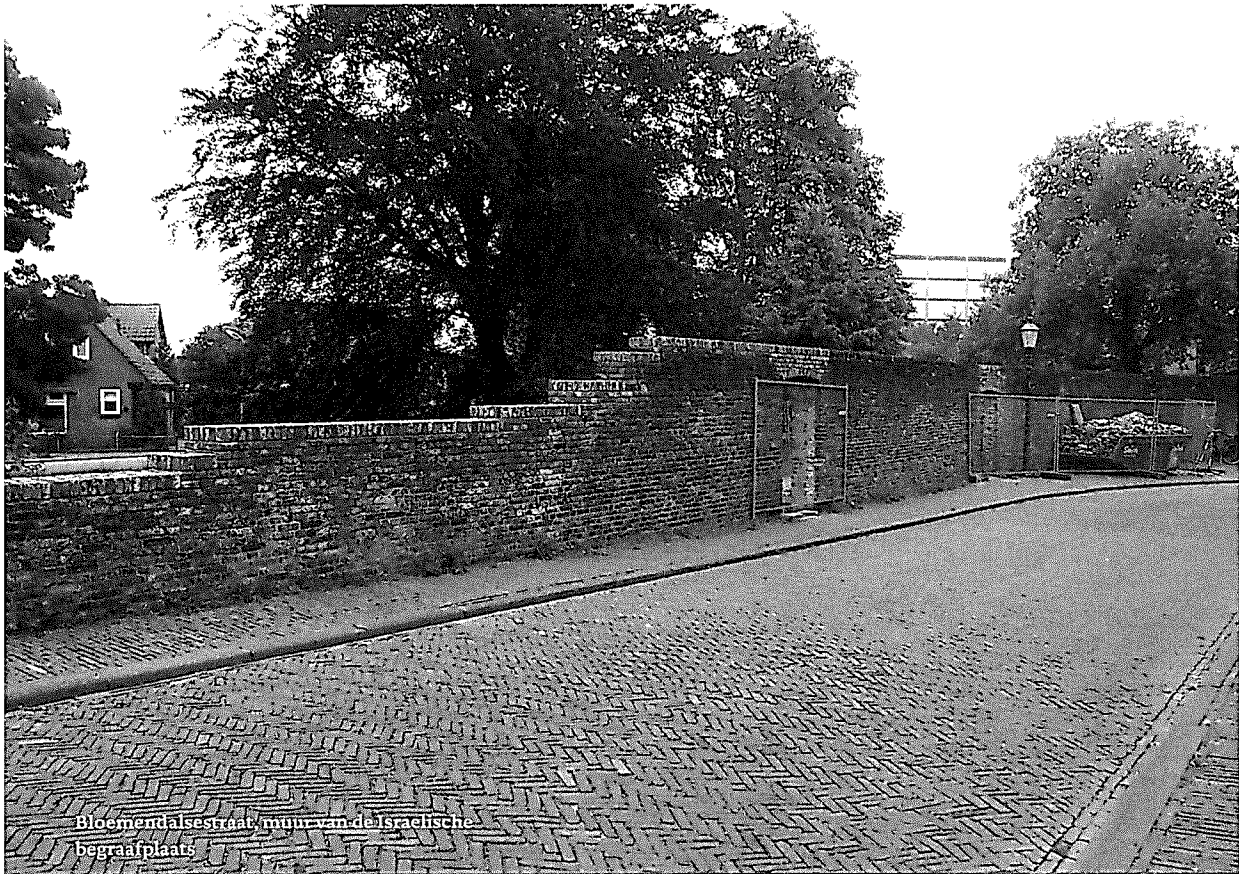
Bloemendalsestraat, muur van de Israëlische begraafplaats