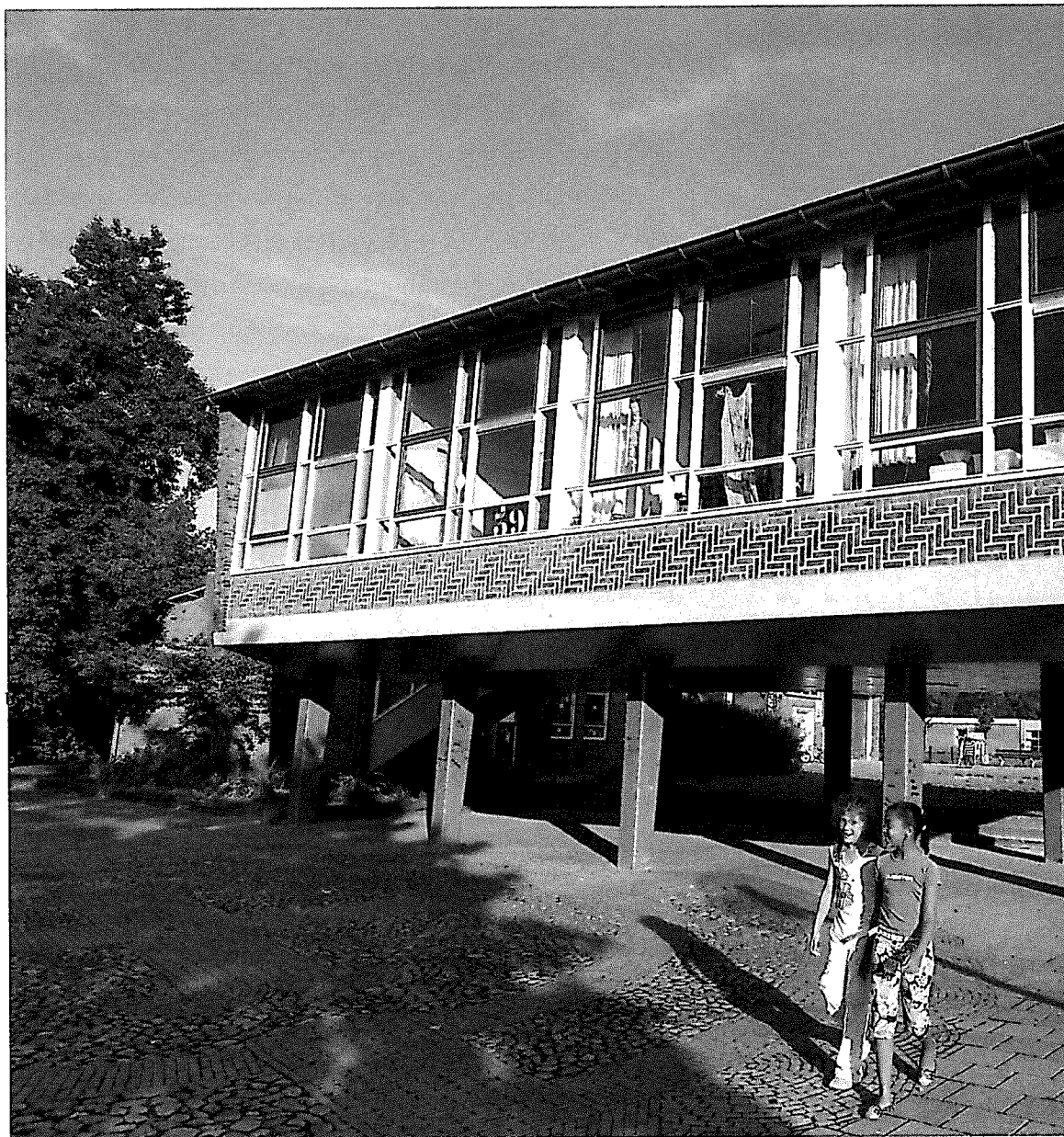
School gebouwd tijdens de wederopbouwperiode na de Tweede Wereldoorlog: Evertsenstraat 39.