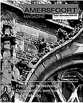
Amersfoort Magazine september 2006.

In 2006 is het gemeentelijk beleid op het terrein van de monumentenzorg met élan voortgezet.