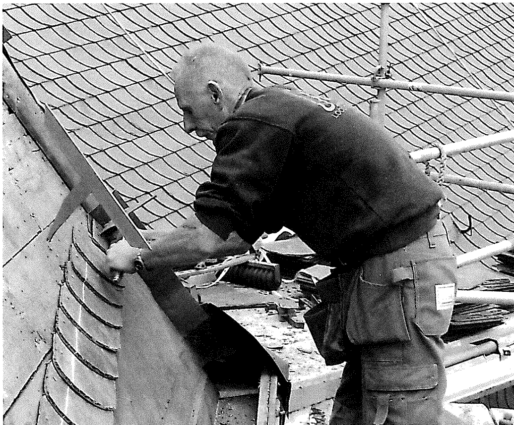
Herstel kap Mannenzaal en kapel van het Sint Pieters- en Bloklands Gasthuis.

ZOO DE HEER HET HUYS NIET EN BOUW TEVERGEEFS ARBEYDE ZY DIE ER AEN BOUWEN. Op grond van oude afbeeldingen zijn reconstructies gemaakt van het bovengenoemde en ooit verdwenen 'smeedwerk', namelijk twee sierlijke ijzeren hekwerken op de dakrand. De zijgevel werd voorzien van stucwerk in blokverband met schijnvoegen, conform de oorspronkelijke toestand. Uiteraard zijn ook de daken hersteld waarmee het exterieur van Varkensmarkt 1 weer geheel in goede staat is gebracht. Een aanwinst voor het stadshart van Amersfoort.