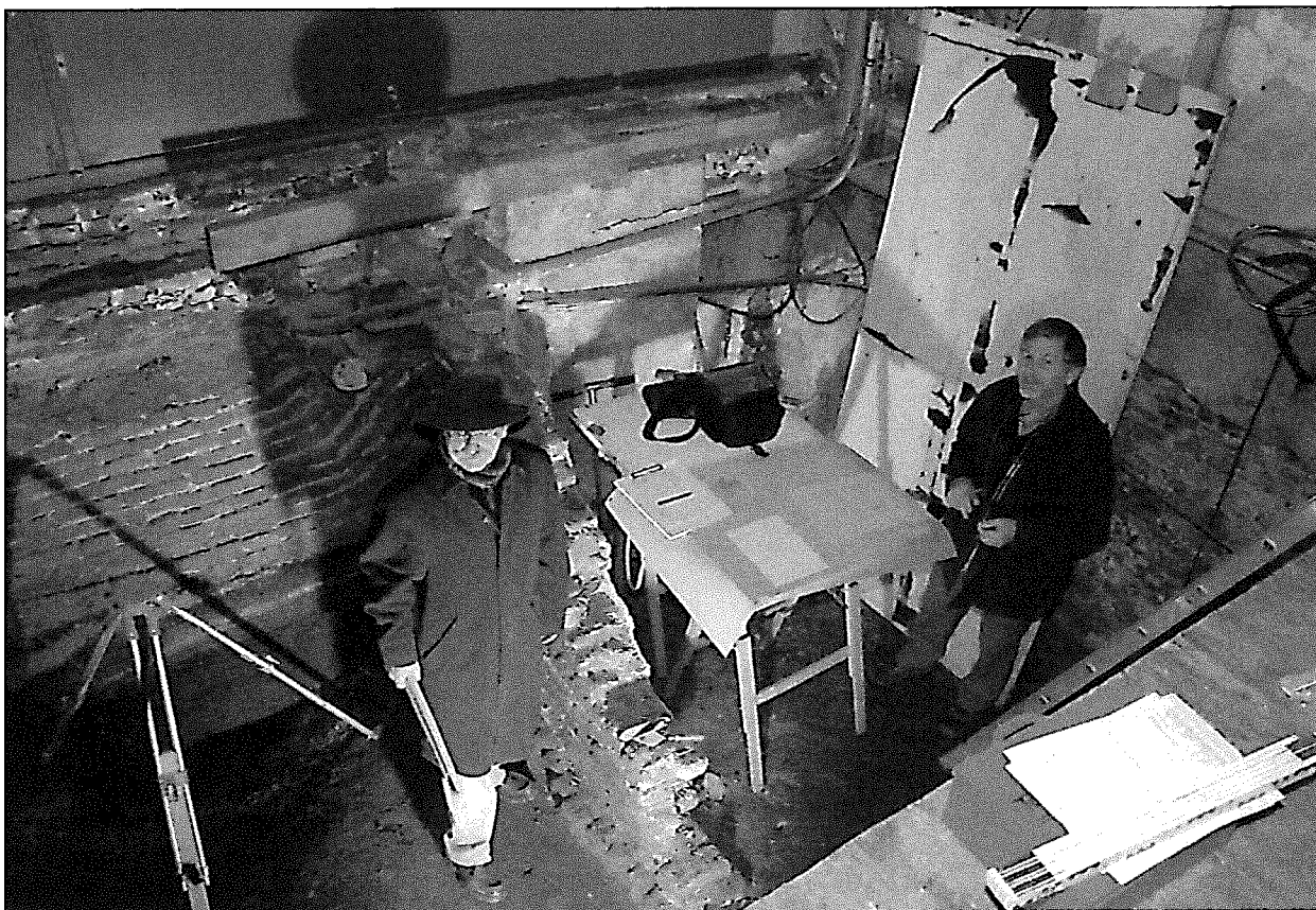
Archeologen onder het pand Lieve-Vrouwekerkhof 2a, bezig met opmeten van het muurwerk.

stenen keermuur die de grond van het plantsoen achter de St. Aegtenkapel en de panden 't Zand 29 t/m 41 op zijn plaats houdt. Het grondwerk is begeleid door de sectie archeologie, waarbij de mogelijkheid werd aangegrepen twee grondboringen te doen, met als doel de loop van de Oude Eem op te sporen.