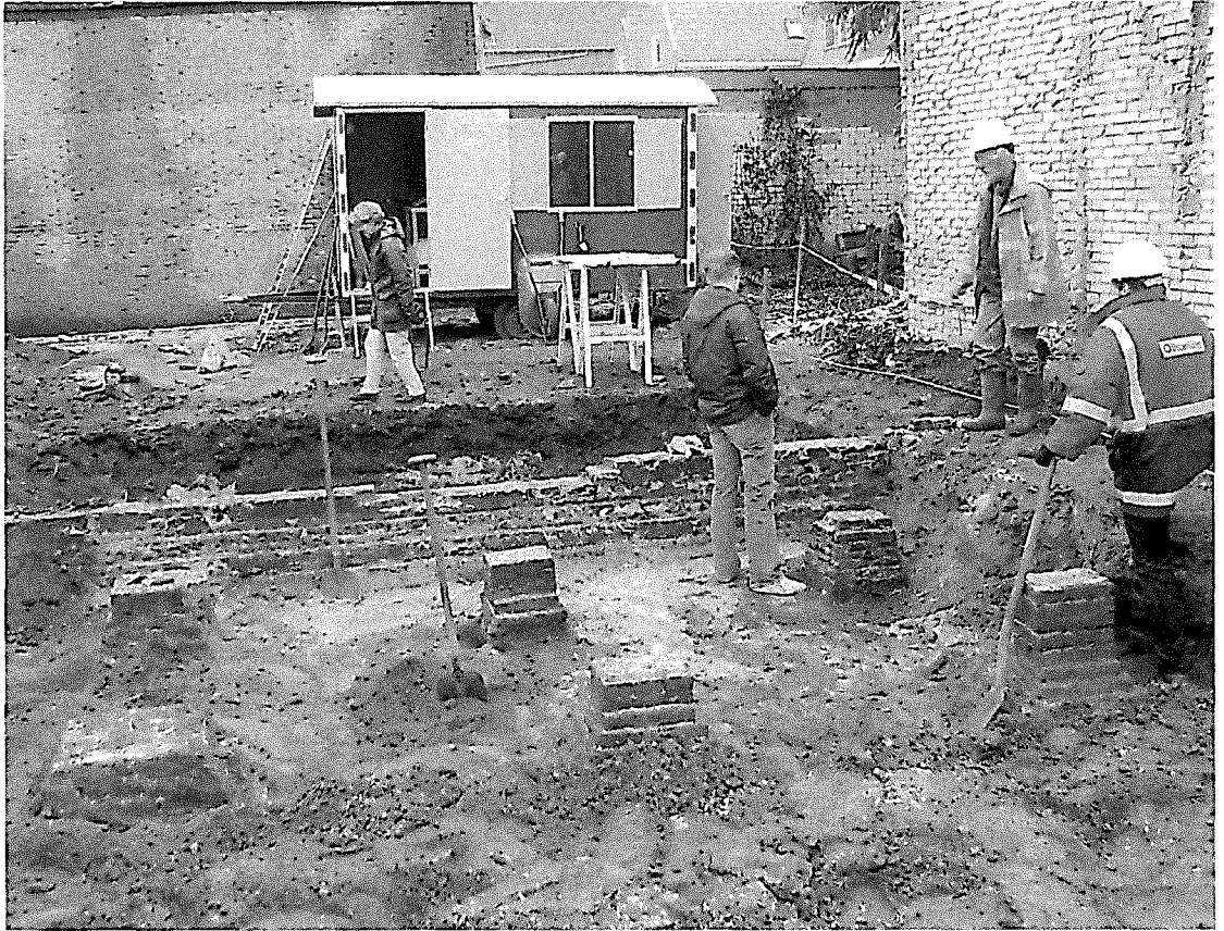
Oliesteeg, opgraving met poeren van grote 19 e -eeuwse schuur.

ouderdom van deze sporen worden vastgesteld. Deze akkerlaag komt overeen met die bij archeologisch onderzoek op het Lieve Vrouwekerkhof in 1986, samen met sporen van een boerderij, aangetroffen zijn en die stammen uit de 12 e eeuw.