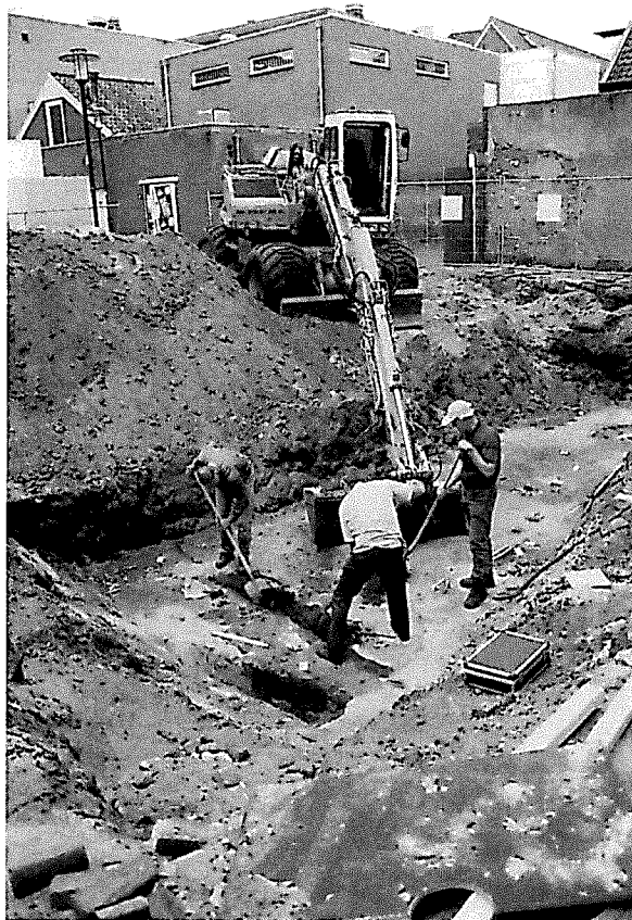
Archeologisch onderzoek Achter de Arnhemse Poortwal.

Het vroegste bewijs van menselijke activiteit, dat bij deze opgraving werd gevonden, is een akkerlaag die in de 13 e en 14 e eeuw ontstaan moet zijn. Ook sloten en greppels duiden erop dat vanaf de 13 e eeuw mensen in dit gebied actief zijn geweest. Het akkerland was van boeren die in de directe omgeving hun bedrijf hadden. Heel dichtbij zelfs: want toen de sectie archeologie in 2000, voorafgaand aan de bouw van het winkelcentrum Amicitia, archeologisch onderzoek uitvoerde, zijn de resten van twee boerderijen uit de 14 e eeuw gevonden. (zie JAARBOEK FLEHITE 2000.) Ook in het gebied Achter de Arnhemse Poortwal, dat in 2005 is onderzocht, zijn paalgaten van boerderijen uit de 14 e /15 e eeuw gevonden; hiervan kon echter geen complete huisplattegrond worden gereconstrueerd. De paalsporen bevonden zich wel op regelmatige afstand van elkaar (ca. 2,75 meter) en lagen in lijn. De richting hiervan