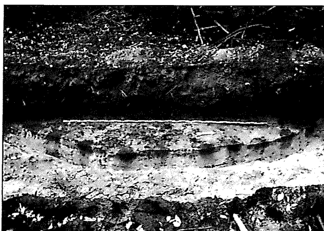
Oud-Leusden: (halve) palenkrans van grafheuvel.

Het vooronderzoek, vooraf gegaan door een booronderzoek door het