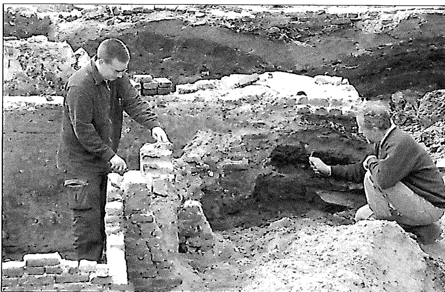
Opgravingen in de Kreupelstraat.

In 2002 vonden in het oude centrum van Amersfoort de volgende opgra-