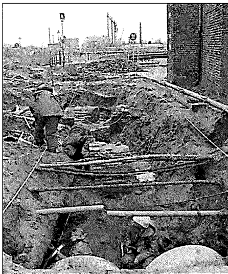
Muurrestanten bij opgravingen bij de Koppelpoort op het Kleine Spui.

Aan de buitenzijde van de muurfundering was echter een heel fors muurwerk gebouwd en dit was