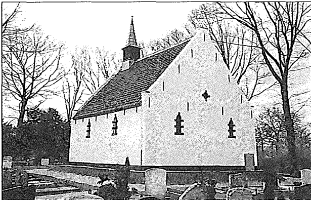
Kapel van Koelhorst na de restauratie Foto Collectie Monumentenzorg.

ontgraven en aangemetseld. Vervolgens zijn de gescheurde en verzakte geveldelen verwijderd en opnieuw gemetseld met oude bakstenen.