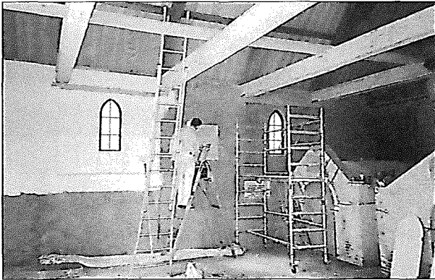
Interieur van de kapel van Koelhorst tijdens de restauratie van 2002-2003, als laatste handeling is de kapel van binnen en van buiten van een kleverige afwerking voorzien