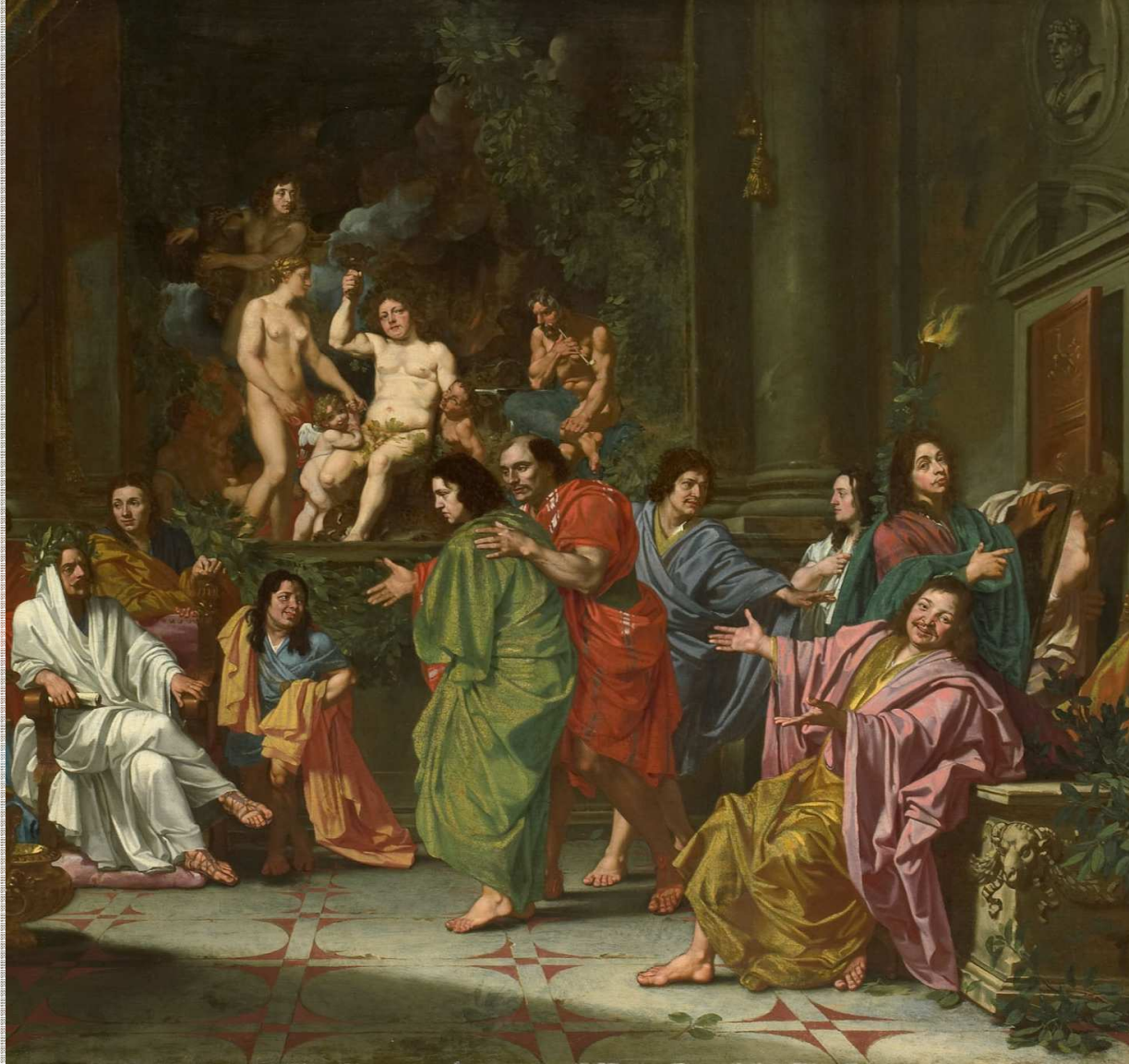
Inwijding van een nieuw lid van de Bentveughels te Rome