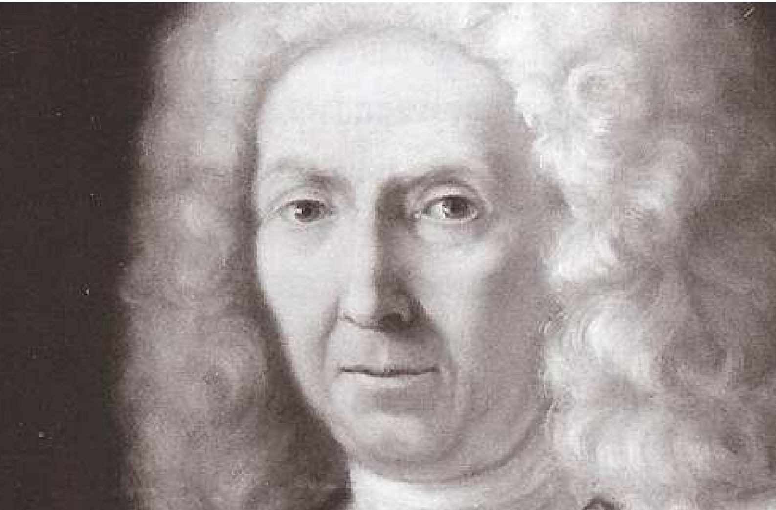
Caspar van Wittel, portret door zijn zoon Luigi

In 1736 sterft Caspar op 83-jarige leeftijd. Hij is dus zeker voor die tijd een heel oude man geworden en we kunnen gerust stellen dat hij een goed en gelukkig leven heeft gehad. In dat verband is wel gesproken over : 'La vita bella di Gaspare Vanvitelli'. En zo is het maar net.