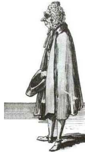
Caricatura di Gaspare Vanvitelli door Pier Leone Ghezzi

Als Caspar tegen de veertig begint te lopen wordt het tijd om over trouwen te gaan nadenken. Echter alvorens in het huwelijksbootje te stappen besluit hij een grote reis