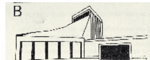
Wijklogo's van Klaas op 't Land uit 1975 en 1979: in dit geval de Fonteinkerk.