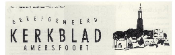
Titelkop van 1991

Vanaf augustus 1994 wordt het blad per post verzonden; zelf rondbrengen lukt kennelijk niet meer. De vrijwillige bijdrage blijft echter f42,50 per jaar (1999 f46). In het laatste nummer van het blad (7 januari 2000) herinnert men zich dat het soms wel eens misging: donderdagmiddag gepost werd dan pas dinsdag bezorgd, 'gelukkig maar een enkele keer'.