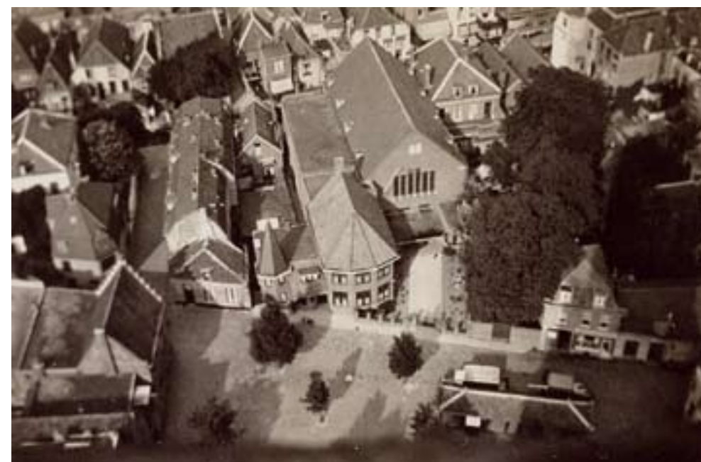
Luchtfoto van het Lieve Vrouwekerkhof met de Grachtkerk, 1932/1950

Daarna kabbelt het blad voort, tot het op 6 mei 1944 wordt omgedoopt in Mededeelingen voor de Gereformeerde Kerken in de Provincie Utrecht , met berichten van de 27 kerken buiten de hoofdstad. Vanaf 16 september is het een puur Amersfoorts blad; berichten van buiten komen alleen vertraagd door. Het is nu een pover velletje A5, eerst tweezijdig en vanaf 29 april 1945 één kant. Na de bevrijding verschijnt op 19 mei weer een tweezijdig A4-tje, maar nu verlaagt men de frequentie naar tweewekelijks. De inhoud is