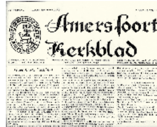
Titelkop van 1963

publiceerde: De Stuw (1946-'49). 33 In juni '56 begint Engelkes met de nieuwe rubriek Amersfoorts Jeugdnieuws . In augustus '58 schrijft hij voor het eerst en positief over 'De vrouw in het ambt'. Het gesprek gaat in de jaren vijftig vaak over emigratie, maar ik vond slechts drie artikelen: in juni 1950 en april 1952.