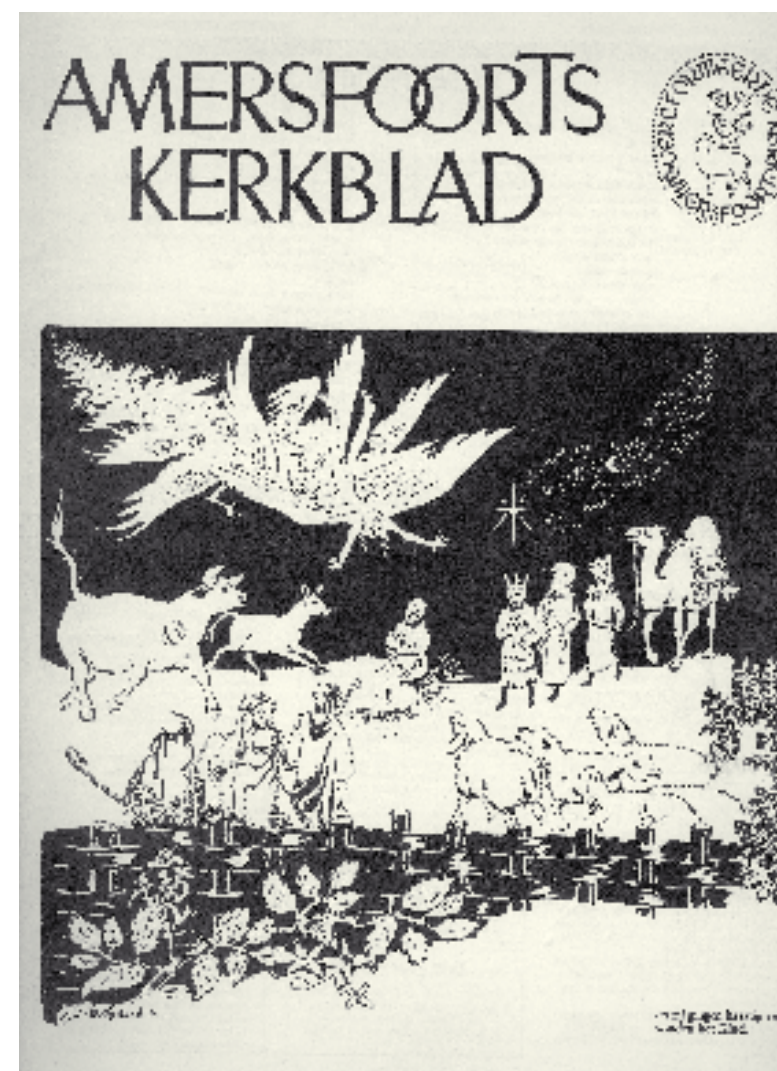
Het kerstnummer van 1974