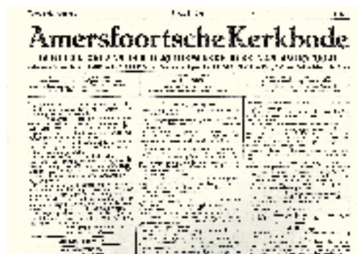
Titelkoppen van 1931, 1941, 1944