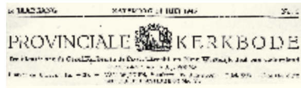
De scheuring in titelkoppen uit 1945