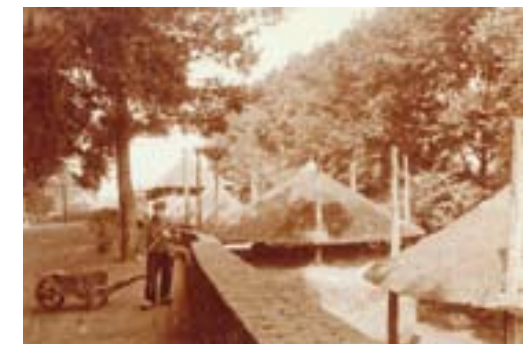
Foto uit circa 1920 waarop het gedeelte van de tweede stadsmuur tussen Coninckstraat en Kamp is te zien. Aan de buitenzijde van de muur staan hooibergen.

In de 11 e eeuw vestigden zich in het latere stedelijke gebied boeren op de zandige uitlopers