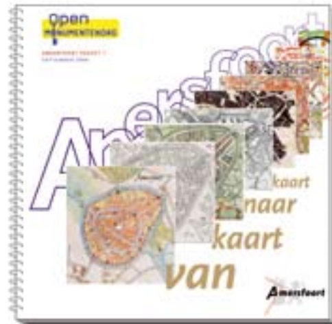
De pocket 'Amersfoort van Kaart naar Kaart' bleek een groot succes en was op de eerste dag al uitverkocht.

Naar schatting maakten ruim 25.000 deelnemers van de gelegenheid gebruik de opengestelde monumenten te bezoeken. De voor deze dag uitgebrachte pocket 'Amersfoort, van kaart naar kaart', waarin veel stadsplattegronden waren samengebracht en van een toelichting waren voorzien, was in één dag zelfs uitverkocht.