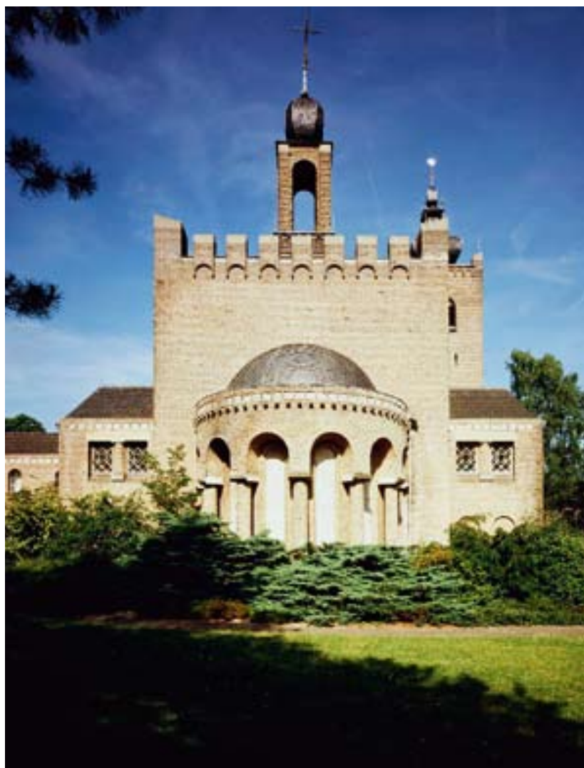
Het complex van het voormalige Kruisherenklooster behoort tot de top 100 monumenten uit de Wederopbouwperiode.

Leeuwarden werd het programma zodanig aangepast, dat gebruik gemaakt kan worden van de officiële adresbestanden van de gemeente. In het monumentenbeheersysteem worden de officiële redengevende omschrijvingen, aanvullende literatuur en de ‘paspoort-gegevens’, zoals bouwjaar, naam van de architect en de bouwstijl opgenomen. Hierdoor zijn deze gegevens voor de eigenaar en geïnteresseerden snel beschikbaar.