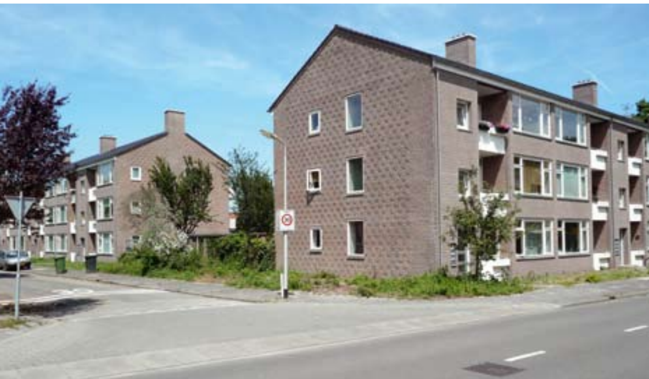
Amersfoort kent een groot aantal waardevolle gebouwen en complexen uit de jaren vijftig. Ook voorbeel-

economische situatie. Sterker nog: waar veel nieuwe ontwikkelingen stagneerden, leek het aantal verbouw- en herstelwerkzaamheden aan de bestaande bebouwing te stijgen. Wellicht kozen veel eigenaren, ook door de onrust op de huizenmarkt, ervoor om de bestaande woning aan te passen. In het afgelopen jaar werden dan ook veel verbouwingen en herstellingen aan de woonhuismonumenten uitgevoerd.