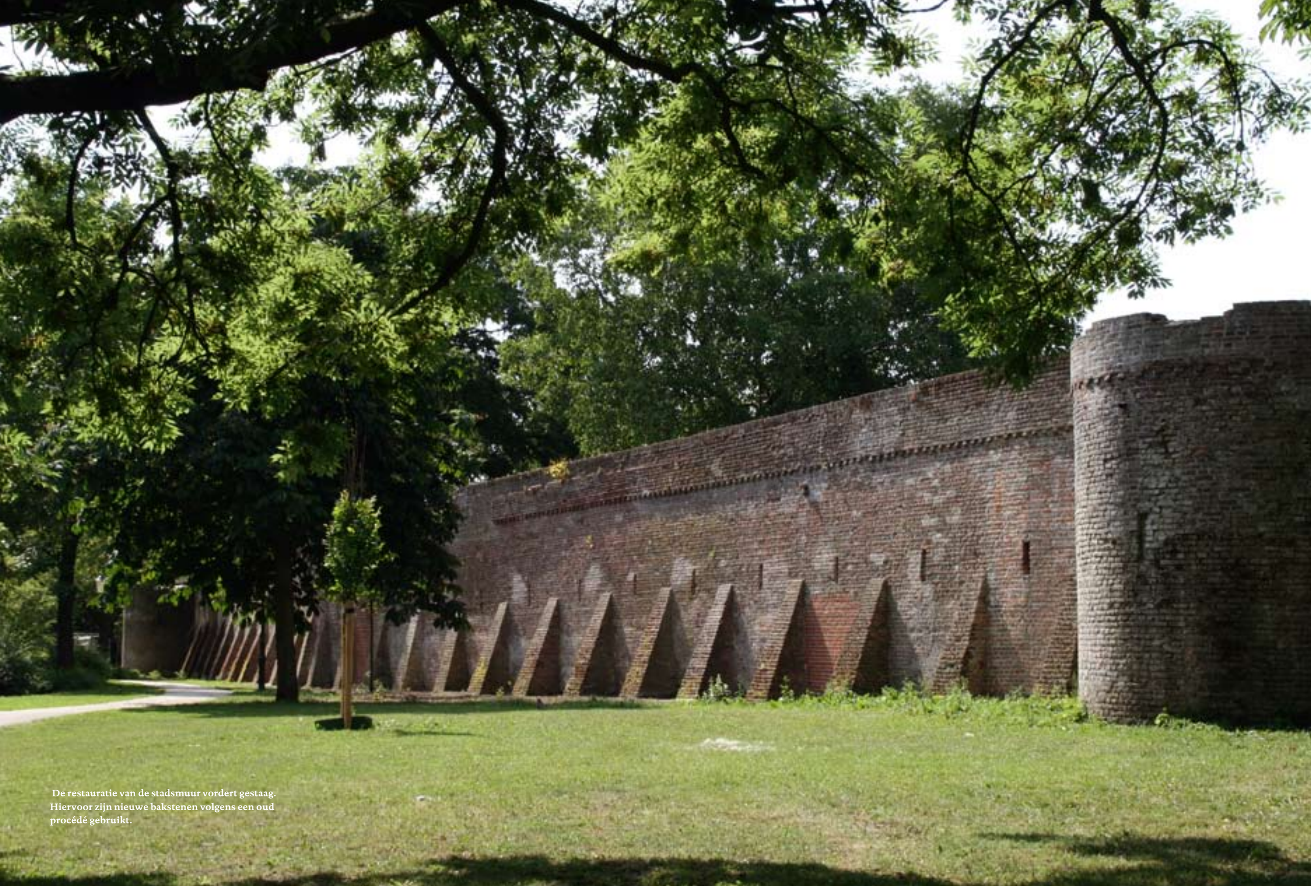
De restauratie van de stadsmuur vordert gestaag. Hiervoor zijn nieuwe bakstenen volgens een oud procédé gebruikt.