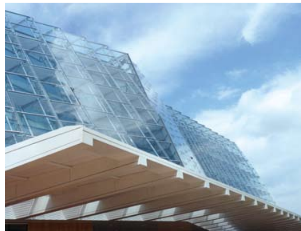
Het nieuwe gebouw van de Rijksdienst voor het Cultureel Erfgoed was ook tijdens de Open Monumentendagen te bezichtigen.

In sommige gevallen leveren verbouwingen