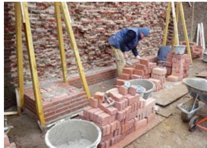
Op twee plaatsen moest ter versteviging van de oude muur een nieuwe steunbeer worden toegevoegd.