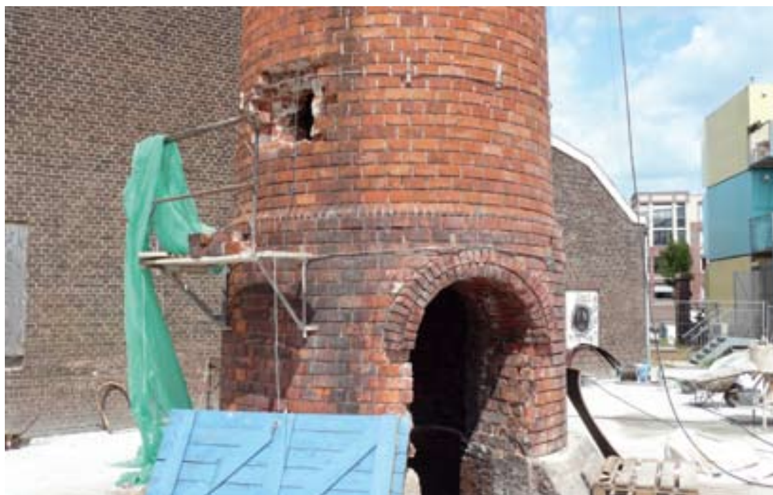
De schoorsteen van Rohm & Haas blijft na de restauratie een stedenbouwkundig ankerpunt in het Oliemolenkwartier.

Aangevangen werd met het meest slechte deel ter hoogte van de Pothstraat. De muur was