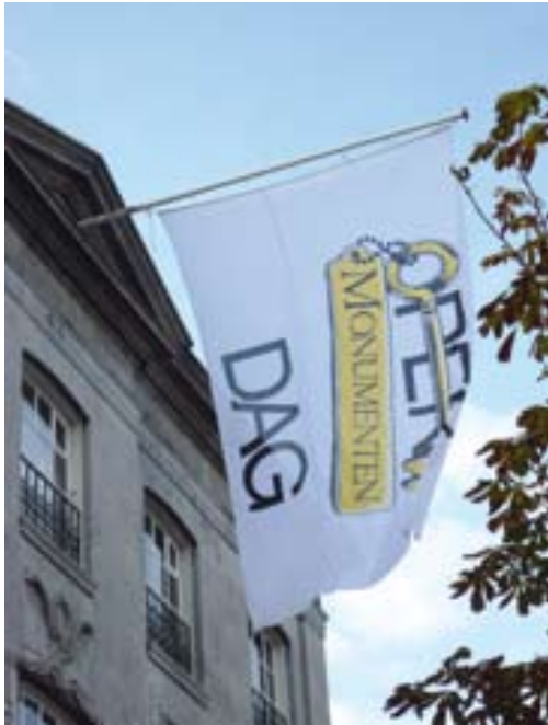
De open monumentendagen trokken ruim 25.000 bezoekers.