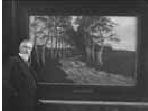
Herfst (Berkenlaan) , schilderij waarmee Adolphe van Weezel Errens in 1906 te Lyon een gouden medaille won

Meestal exposeerde hij dicht bij huis: in de 'uitstallkast voor kunstwerken' of kunstvitrine in