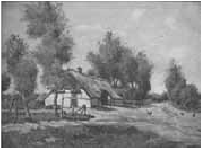
Drentse boerderij , olieverf op doek

En inderdaad: “De Sturm und Drang der huidige kunst valt misschien buiten mijn gedachtsfeer”, zegt hij in een interview: “De zachte, vloeiende schoonheid der natuur is in zijn ogen eeuwig en onveranderlijk. Men moet er vooral niet mee experimenteren – men moet zich alleen maar open stellen voor het wonder.” Zoo kan hij zich verdroomen in de stemming, de lyriek van de paarsige heide, zich verdiepen in het spel van atmosfeer en kleuren ... met eerbied voor de