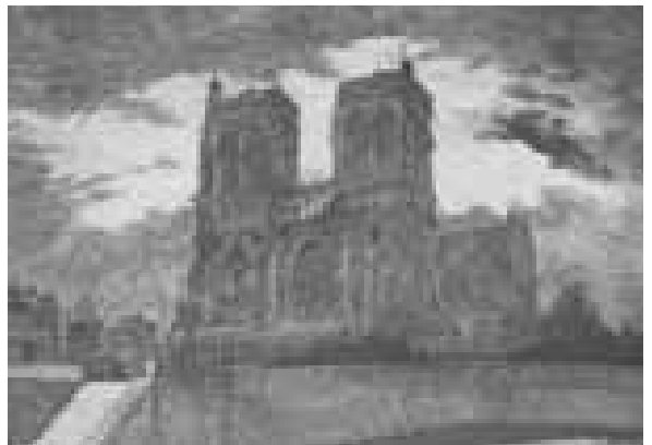
Notre Dame te Parijs . Ets, na 1906, vermoedelijk in zinkplaat gebracht op basis van ter plaatse getekende voorstudies. De etsplaat bevindt zich in de collectie van Museum Flehite, Amersfoort.

Nog tijdens zijn studie vond een naamswijziging plaats. In 1884 verkreeg zijn vader Koninklijke toestemming om de achternaam van zijn vrouw vóór zijn eigen naam te plaatsen, omdat zij de laatste naamdraagster van haar geslacht was. Ook al hun wettelijke nakomelingen zouden voortaan de naam Van Weezel Errens dragen. 10