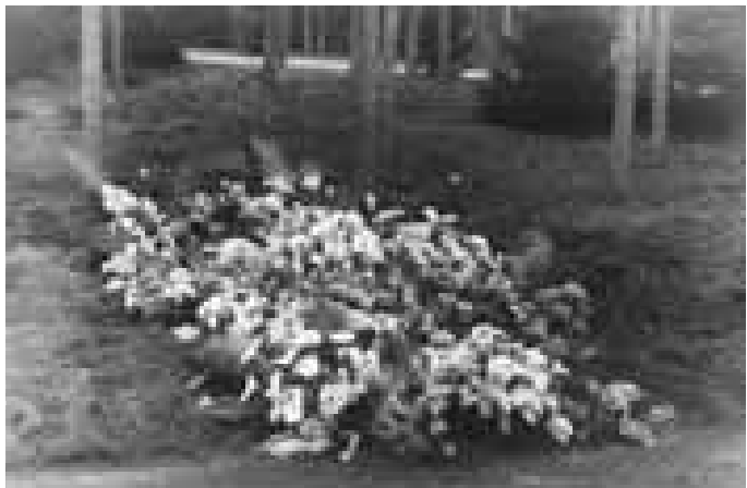
Het graf op de begraafplaats Rusthof kort na de bijzetting, maart 1939