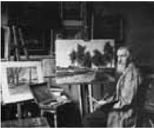
Atelier achter het woonhuis Barchman Wuytierslaan 194 te Amersfoort, ca. 1936