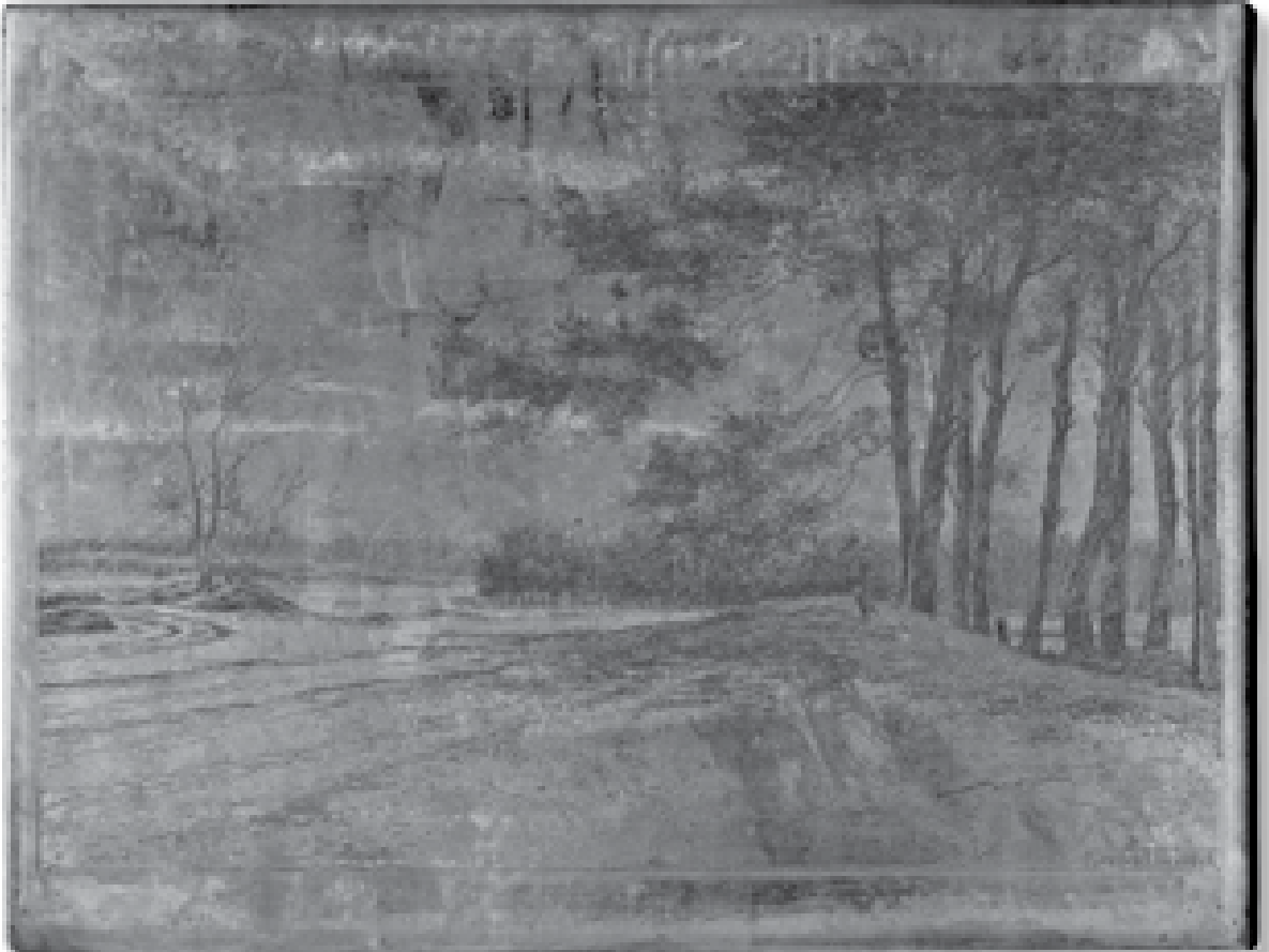
Etsplaat, zink, getiteld Soesterduinen