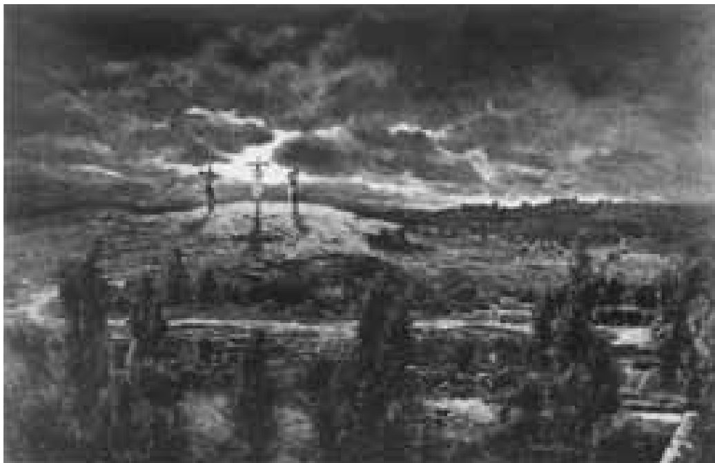
Consummatum est (Het is volbracht), schilderij 1915. De voorbereidende schetsen werden gemaakt op de achterkant van kalenderbladen van 1915, uitgegeven door Amersfoortse bedrijven.

bijkomstigheid, maar gaat het vooral om de atmosfeer en stemming. 63 Met name in de niet nader met plaatsnaam aangeduide 'heitjes' lijkt een ateliercompositie geen uitzondering te zijn, waarbij een bepaalde vergroeiing in een berkenstam een kenmerkend element is.