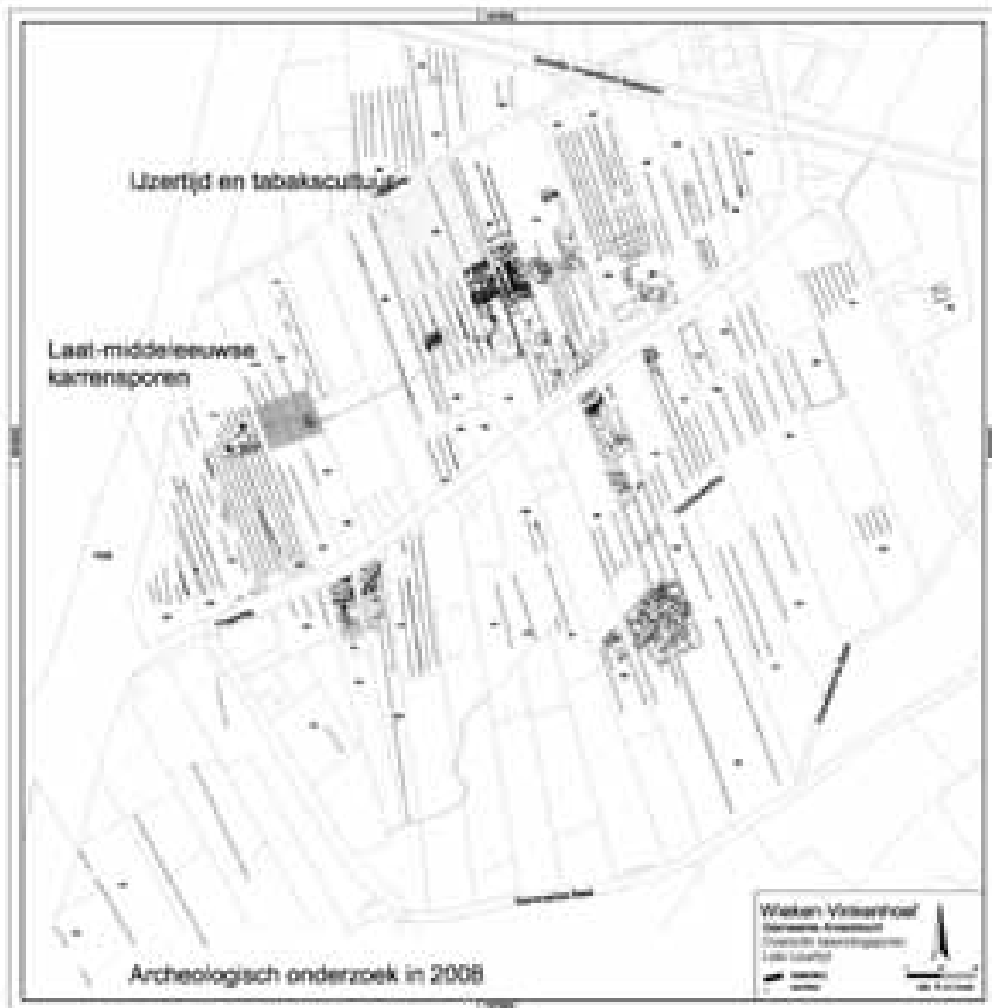
Overzicht van de resultaten van het archeologisch onderzoek in Wijken – Vinkenhoef

de wanden voorzien waren van verticaal draaiende luiken om een luchtcirculatie op gang te houden voor het drogen van de tabaksbladeren. Tussen de wand- en binnenstijlen waren horizontale latten (hanken) bevestigd waaraan de bladen hingen. Gezien het in de paalkuilen gevonden materiaal moeten de tabaksschuren uit de 17 e en 18 e eeuw stammen. Amersfoort kende in deze twee eeuwen een bloeiende tabaksteelt en –handel. In de 19 e