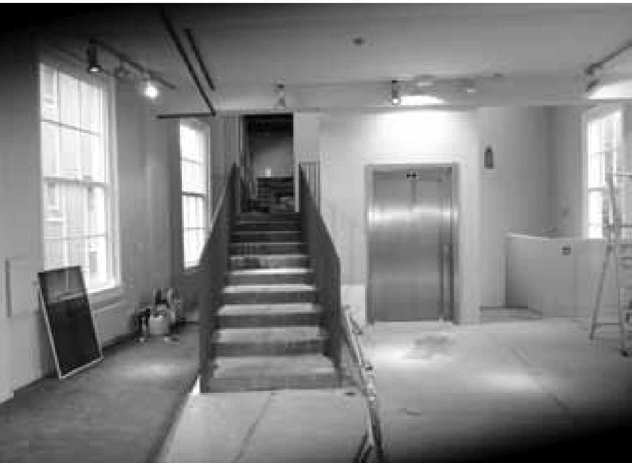
Het nieuwe interieur van museum Flehite tijdens de verbouwing

Menigeeen zal het niet ontgaan zijn dat de Kamperbinnenpoort begin van dit jaar in de steigers heeft gestaan. Zoals ook al in eerdere berichtgevingen gemeld was de restauratie vooral noodzakelijk door scheurvorming in het