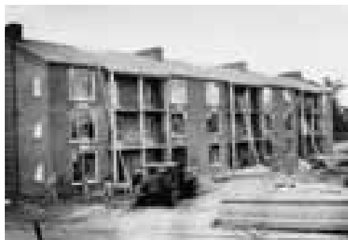
De Ganskuijl in beeld gebracht door fotograaf Cas Oorthuis in het midden van de jaren vijftig.

De aandacht voor de wederopbouwperiode werd in 2008 voortgezet. Al vroeg in het jaar kreeg een