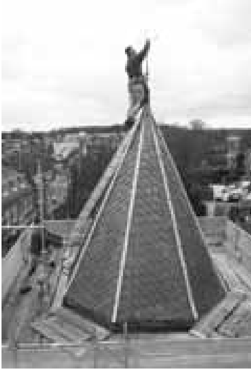
Plaatsen van de torenhaan als afsluiting van de restauratie van de Kamperbinnenpoort

metselwerk. De oorzaak van de scheuren en verzakkingen kwamen voort uit het verzakken van de gemetselde overkluizing over de singel onder de Kamperbinnenpoort. De schade was voornamelijk het gevolg van het vrachtverkeer. De overkluizing is medio jaren negentig vervangen, waarbij boven op het nieuwe tongewelf een betonnen draagconstructie is aangebracht. De aanwezige scheuren in de poort zijn niet direct hersteld, na een degelijke ingreep moet een gebouw zich namelijk “zetten”. Door middel van aangebrachte scheurmeters werd enkele jaren gemeten of er sprake was van verdere werking in het bouwwerk. De laatste jaren bleek de situatie stabiel zodat nu overgegaan kon worden tot herstel. Na aanbesteding is aannemersbedrijf Van de Burgt&Strooij aan de slag gegaan. Zorgvuldig is het metselwerk hersteld met traditionele handvormstenen en door de steenfabriek werden de beschadigde profielstenen exact bijgemaakt.