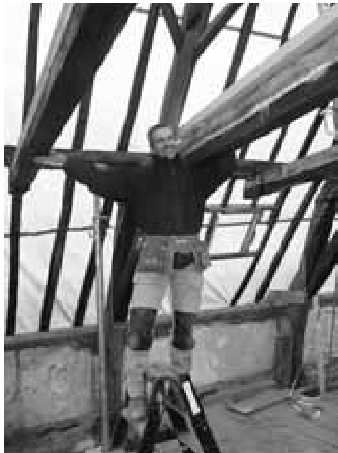
Restauratie van de kap van Havik 37

In 2008 werd gestart met de uitvoering van de restauratiewerkzaamheden door restauratiebedrijf Van de Burgt & Strooij. Door de slechte bouwkundig staat van het huis was ingrijpend herstel noodzakelijk van de kapconstructies, gevels, muren en balklagen. Aansluitend zal de