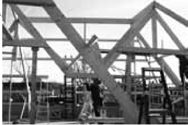
Herbouw van de kap van Langegracht 37 na de brand