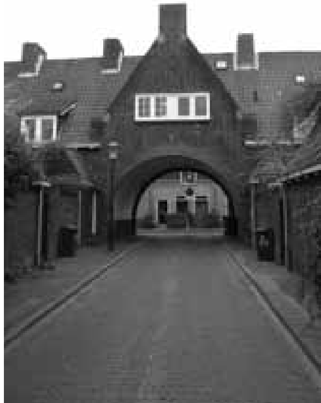
Het Dreijershofje voor de restauratie

en aangepast aan de eisen van deze tijd. Deze gefaseerde aanpak zal de komende jaren worden voortgezet.