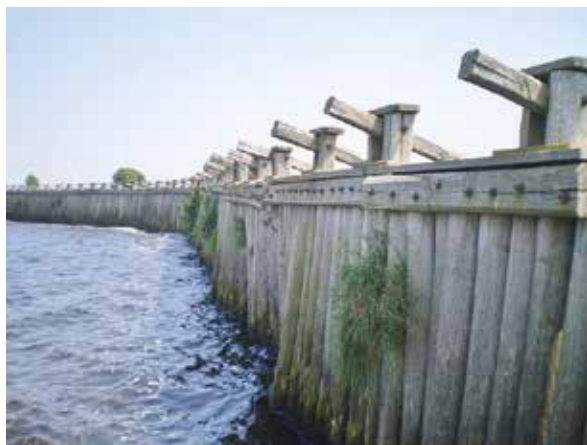
Een historische reconstructie van een stuk palendijk in de Veldendijk bij Bunschoten.