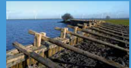
De palendijk bij Oude Pol aan het westelijke uiteinde van de Westdijk bij Spakenburg. Aangelegd door Waterschap Vallei & Eem naar 18 e eeuwse voorbeeld.

Onderzoek naar deze heemraden geeft nieuwe inzichten in de kruisbestuiving tussen de stedelijke ervaring en de oude bestuurscultuur van het Eemlands waterschap. 1