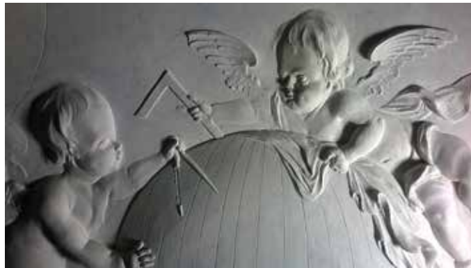
Muurhuizen 3 werd in de 18 e eeuw rijk gedecoreerd met stucwerkornamenten. In de hal is een voorstelling te zien van putti met meetkundige instrumenten, waarschijnlijk verwijzend naar één van de vrije kunsten, de mathematica.