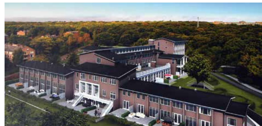
Kapelweg 117, omslag van het projectboek.

kalkzandsteenwanden aan het oog. Daarnaast moest een oplossing worden gezocht om -op het moment dat deze muren weer zichtbaar waren- de vervuiling van de steen te verwijderen.