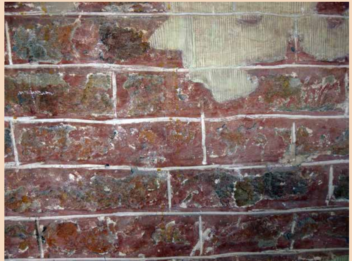
Tijdens een vorige restauratie werd in Muurhuizen 3 de oorspronkelijke middeleeuwse afwerking van de voorgevel teruggevonden (nu in het interieur van de aanbouw aan de voorgevel).