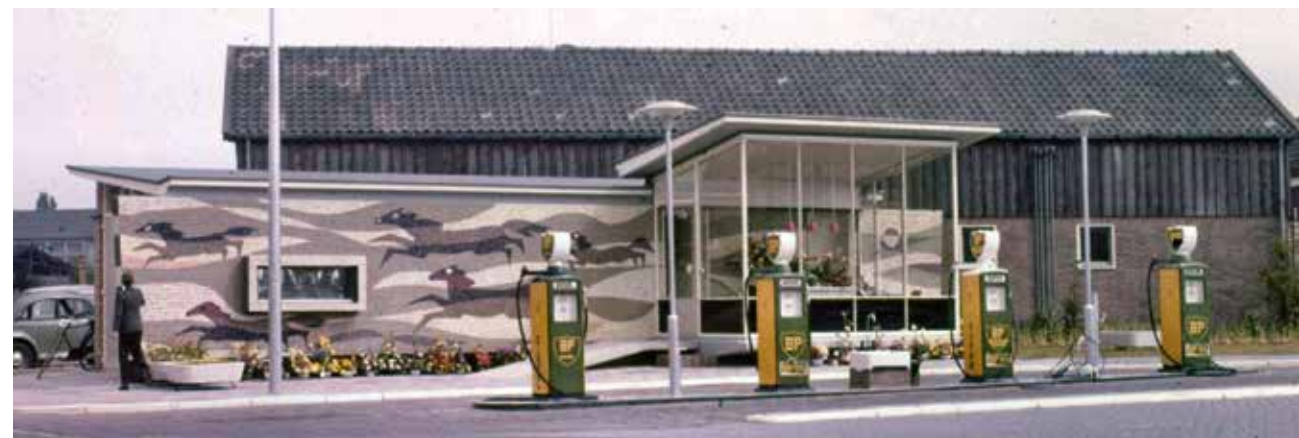
Het benzinestation met de muurschildering van Jan Boon, vlak na de oplevering in 1958.

In 2015 werd met de nieuwe eigenaar van de voormalige Industrie- en Huishoudschool aan de Kapelweg intensief overleg gevoerd over de wijze waarop dit potentiële gemeentelijke monument uit de wederopbouwperiode kon worden herbestemd. Dit schoolgebouw is nauw verbonden met de daaraan grenzende woonwijk Berg-Zuid. De flatwoningen hebben dezelfde richting als de school. Vandaar dat de stedenbouwkundige betekenis van dit pand groot is. Ook de architectonische opbouw van de school is