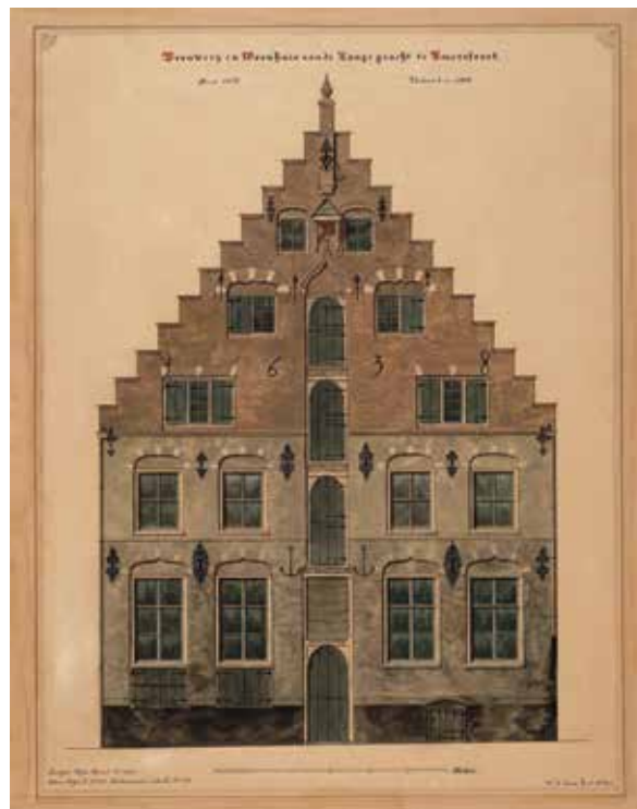
Het Anker, Langegracht 12-13. Brouwerij en woonhuis aan Anno 1638. Verbouwd in 1894.

Tijdens de uitwerking van de restauratie- en verbouwplannen en vooral ook tijdens de uitvoering