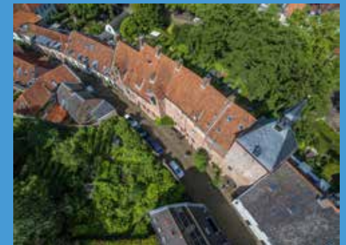
De Muurhuizen van Secretarishuisje tot Dieventoren.

Het Amersfoortse erfgoed was in 2015 weer volop 'in beweging'. Veel monumenten wisselden, waarschijnlijk als gevolg van een aantrekkende economie, van eigenaar. Een dergelijke wisseling vormt altijd een goed moment voor het aanpakken van achterstalig onderhoud, aanpassingen aan nieuwe gebruikswensen, en zeker ook voor een bouw-historisch onderzoek.