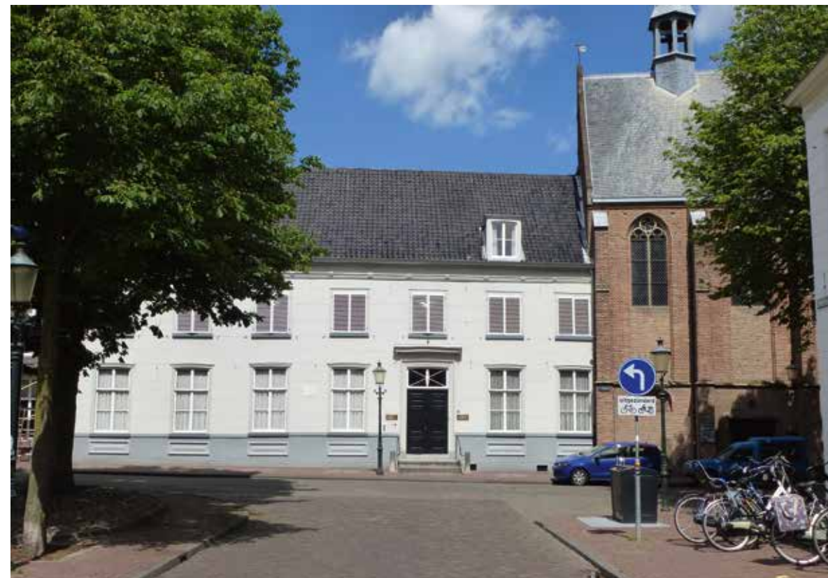
't Zand 39, huidige situatie.

Het Rijksmonument kwam begin 2015 in de verkoop. Bekend was dat dit in het verleden het indrukwekkende pand van brouwerij Het Anker is geweest, met een monumentale hoge trapgevel uit 1638. Aan