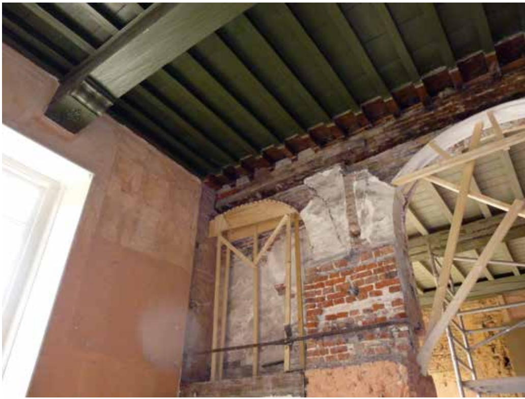
Bij de verbouw- en herstelwerkzaamheden in het interieur werden nieuwe bouwsporen zichtbaar.

De Stichting Armen de Poth biedt in de hofjeswoningen tegenwoordig nog steeds onderdak aan ouderen met een bescheiden inkomen. De regenten vormen het bestuur van de Stichting. De binnenvader is nog steeds verantwoordelijk voor het dagelijks beheer. Het gehele complex is aangewezen als rijksmonument.