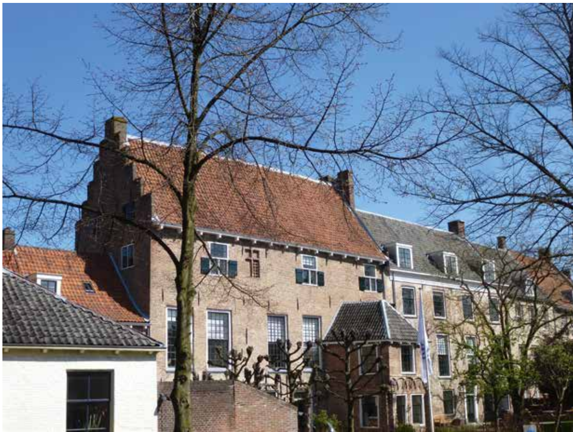
Muurhuizen 1 en 3 vanaf de Singelzijde.