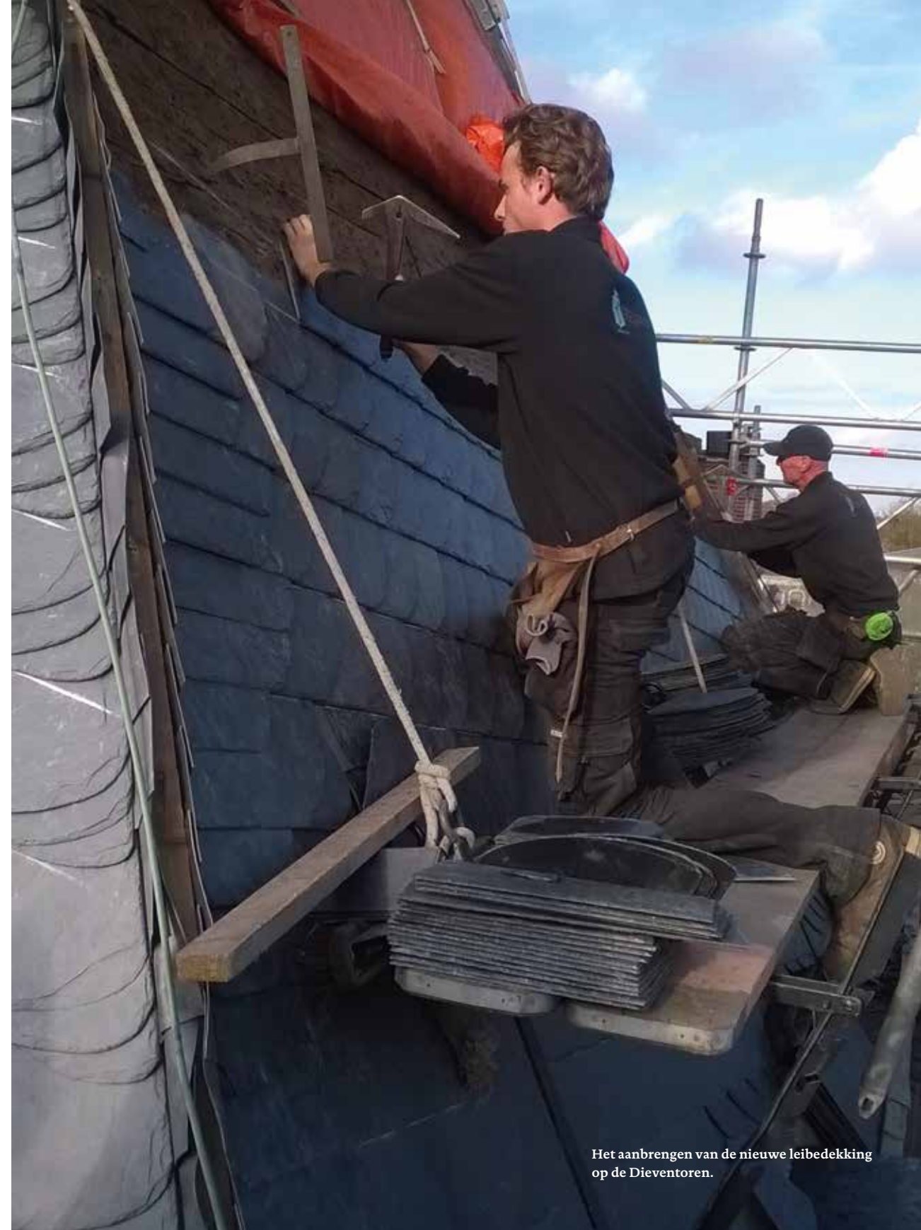
Het aanbrengen van de nieuwe leibedekking op de Dientoren.

De Stichting Open Oog heeft tot doel om de geschiedenis van Amersfoort zichtbaar en afleesbaar te maken in de stad. Eerder schonk de Stichting