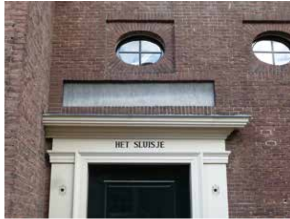
Muurhuizen 199. De 18 e -eeuwse entree met de gevelsteen van de 'Musiecczaal'.

In 1973 kreeg Muurhuizen 199 opnieuw een nieuwe eigenaar, mr. Van der Lely. Hij liet het vervallen pand ingrijpend restaureren en verbouwen. De gestuukte plafonds en de schouw waren in verval geraakt en werden verwijderd. Daarmee werd op de verdieping de oorspronkelijke moer- en kinderbinten-balklaag weer zichtbaar. Deze was voorzien van sleutelstukken met peerkralen en later tussen gelegde balken. Ook deze balklaag werd hersteld. De balklaag op de begane grond moest worden vernieuwd. Ook de ramen in de achtergevel werden vernieuwd en kregen op de verdieping weer de vijfde 18 e eeuwse roedenverdeling. Ook de kapconstructie moest in 1974 worden vervangen. Vanwege