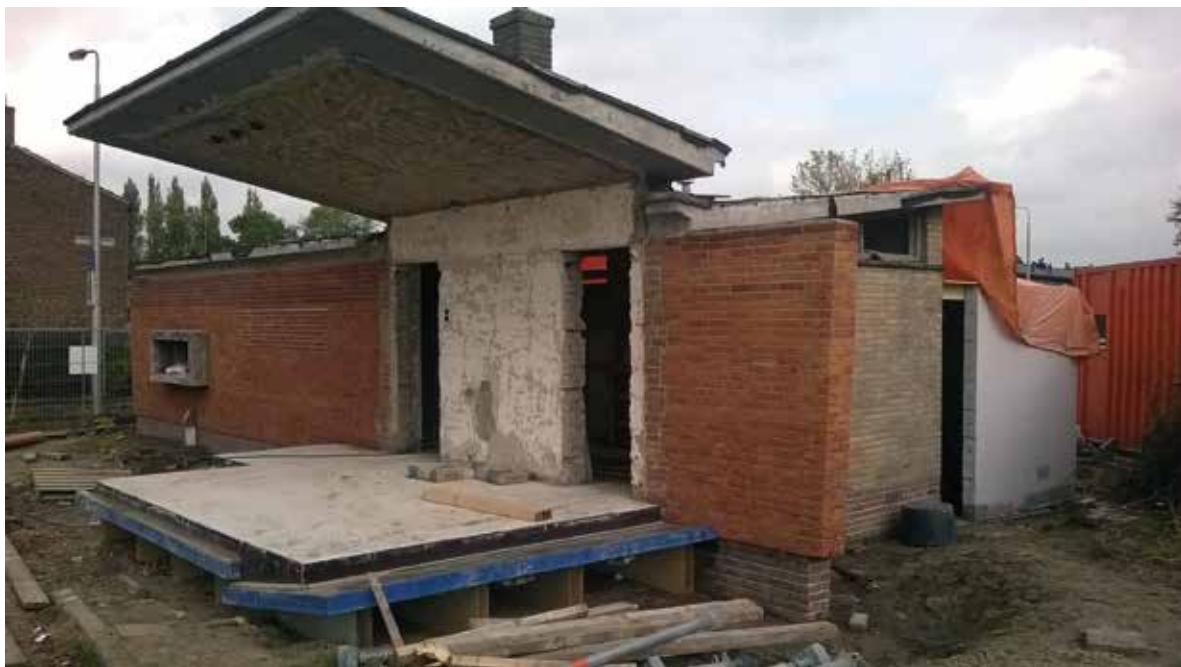
Tijdens de ontmanteling werd de oorspronkelijke betonconstructie met het bijzondere 'vleugeldak' goed zichtbaar.

bijzonder. Uitgangspunt voor de plannen was dan ook het behoud van de markante massaopbouw. Er werd voor een niet alledaagse methode gekozen. Door de te geringe verdiepinghoogte was het niet overal mogelijk om op verantwoorde wijze woningen in het complex onder te brengen. Vandaar dat besloten werd om een aantal vleugels af te breken en in dezelfde vorm en detaillering te herbouwen. De plannen werden met enthousiasme ontvangen, wat bleek uit de grote belangstelling voor de woningen. De omslag van het projectboek, waarin de woningen werden gepresenteerd, toont de hoge ambitie van de opdrachtgever (zie de afbeelding op bladzijde 161). In 2016 zal met de sloop en opbouw een aanvang worden gemaakt.