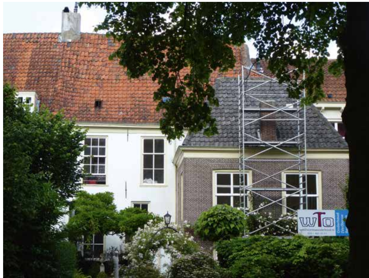
De tuinzijde van Muurhuizen 31, met het 18 e -eeuwse achterhuis.