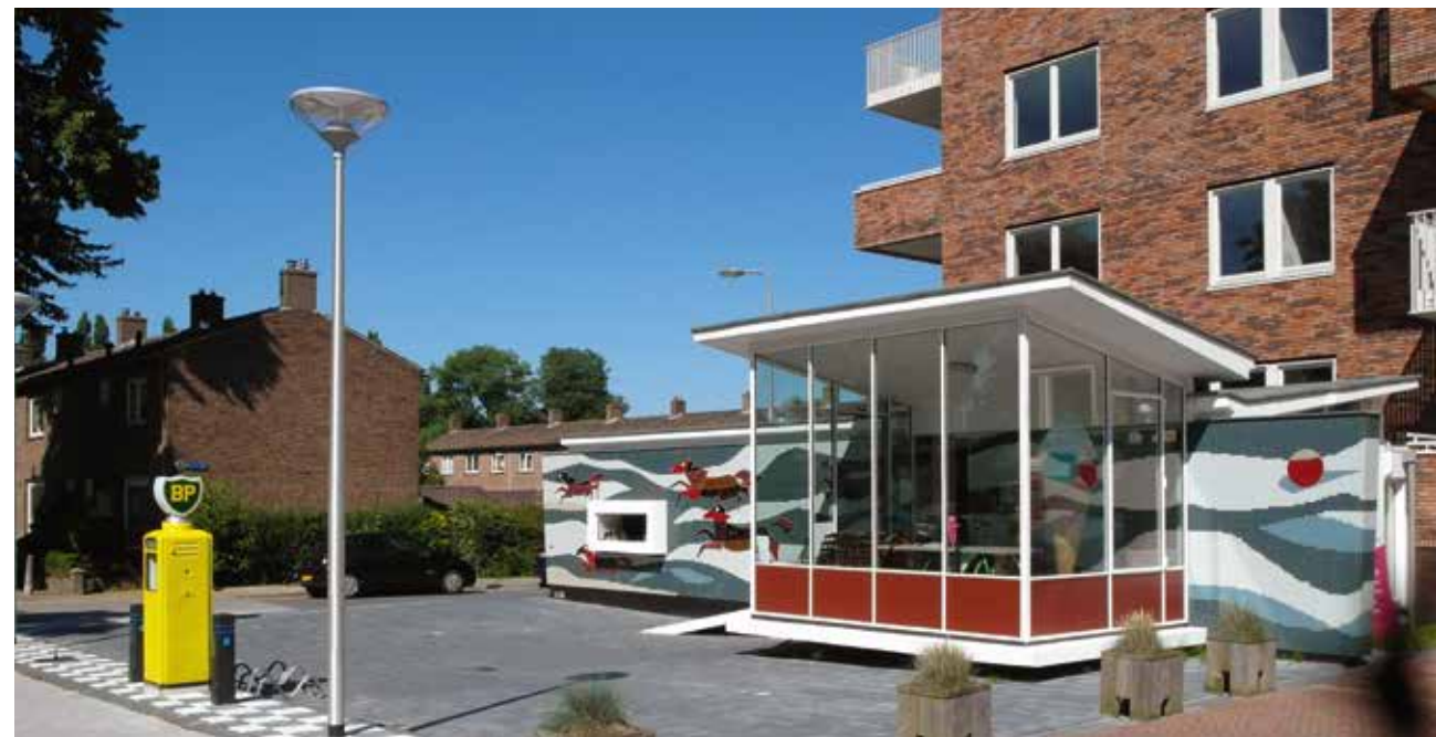
↙ ↑ Het nieuwe mozaïek met de paarden is geïnspireerd op het oorspronkelijke kunstwerk van Jan Boon.

rol zou kunnen spelen. Geconstateerd werd dat door de tijdelijke functies die in het pand waren ondergebracht, de ruimtelijke kwaliteit van het gemeentelijke monument was verminderd. In het bijzonder de beplating die in het verleden voor het Armandomuseum was aangebracht onttrok de kenmerkende