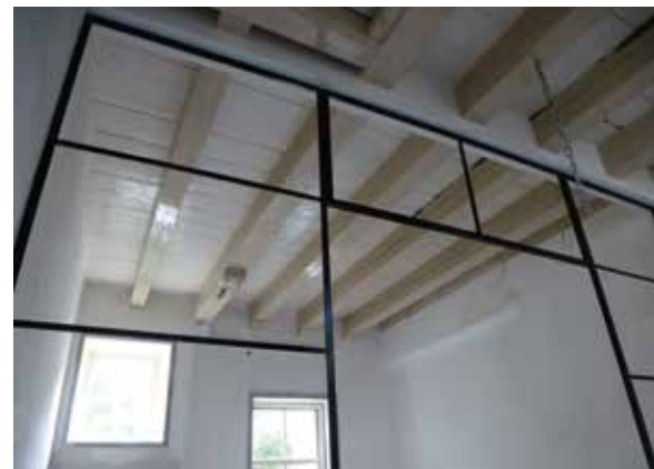
De hal van Muurhuizen 31 met de historische balklaag en de nieuwe pui.

Bij een kort onderzoek werd al snel duidelijk dat achter de classicistische voorgevel uit de 19 e eeuw een ouder pand schuilgaat. Oorspronkelijk was dit een verdieping hoger en maakte het deel uit van het middeleeuwse kloostercomplex Sint Aegten. Op de prent van Van Liender uit 1759 is het hogere pand nog goed te zien. De kloosterfunctie is dan al lang verdwenen en het huis kreeg daarna diverse gebruikers. In 1703 werd de bekende Amersfoortse historieschrijver -en notaris- Abraham van Bemmelen hier geboren.