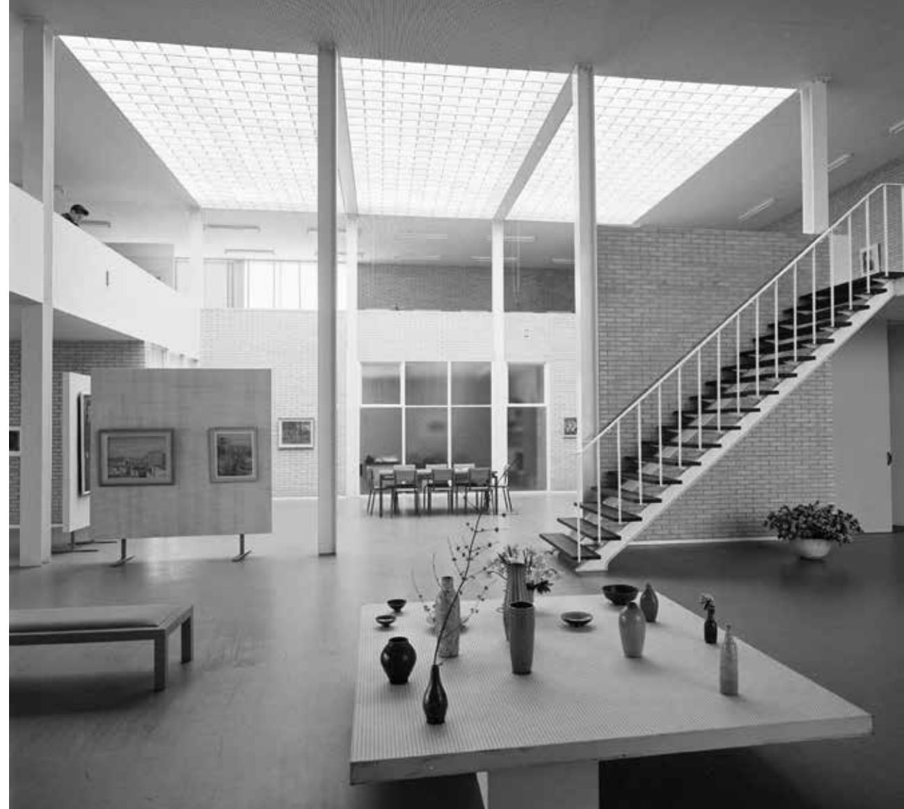
Het interieur van het Rietveldpaviljoen in 1956.

De Waterlijn organiseert jaarlijks een gedegen cursusprogramma om nieuwe en bestaande schippers op te leiden. Ook Monumentenzorg draagt daaraan bij met een cursus over de monumenten en