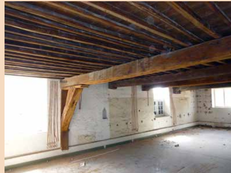
De historische houtconstructies in Muurhuizen 1 en 3 bleken deels verrassend oud.