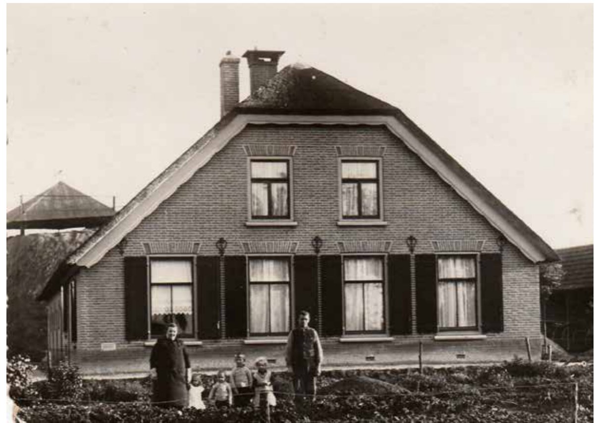
Vader, moeder en de vier oudste kinderen Voskuilen voor de boerderij aan de Hogeweg 215.

Op de eerste avond was er nog niet veel te merken van oorlogsgeweld. Wel werd verordeneerd dat