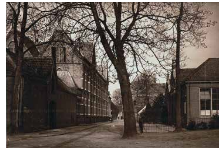
Rijksskweekschool, rechts op de ansichtkaart.