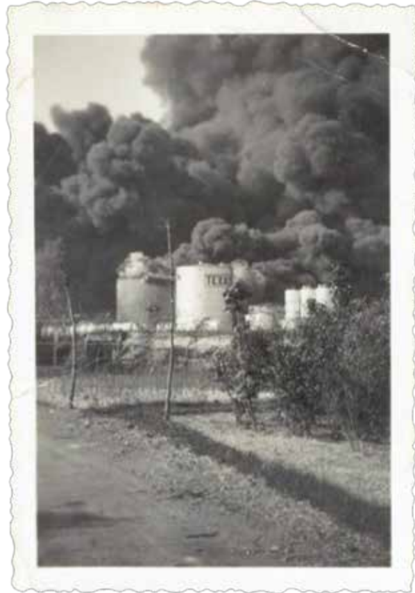
Brandende olietanks in de Oostelijke Petroleumhaven.