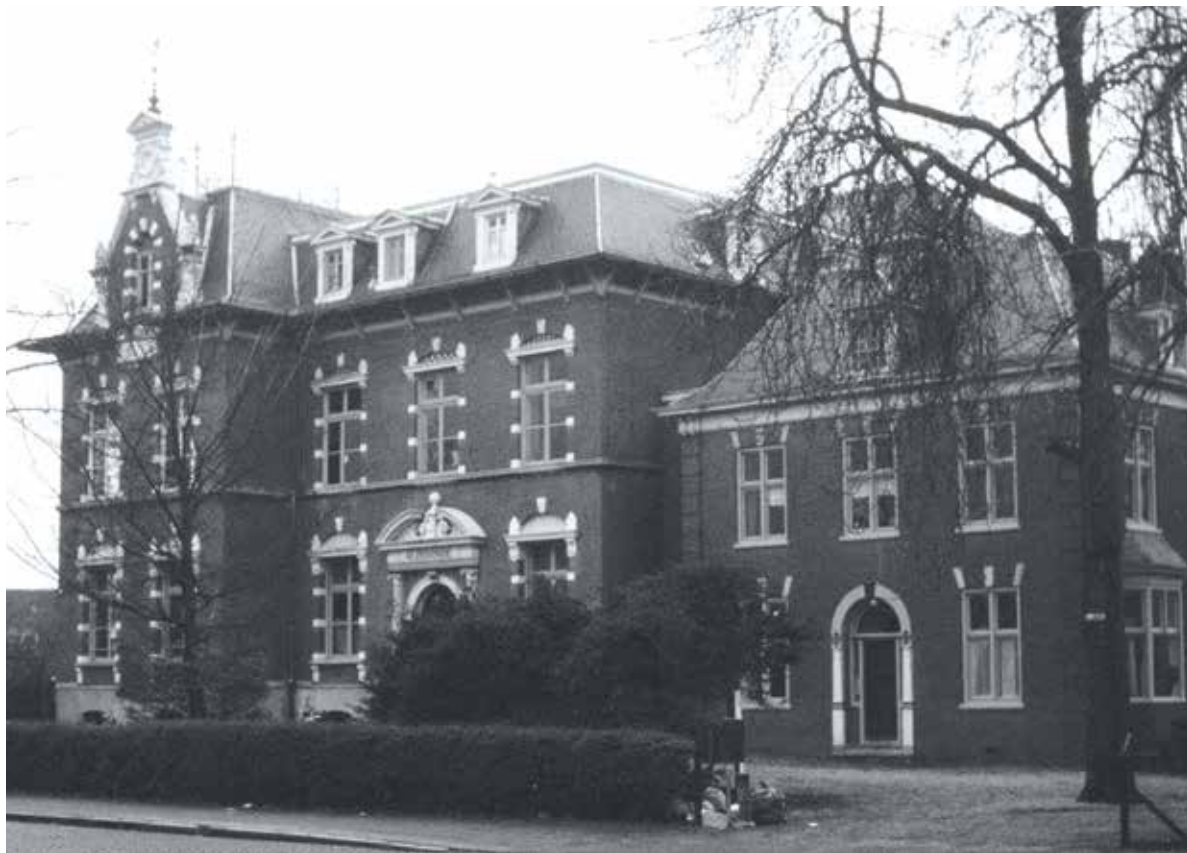
Gebouw kind verzorg Aldegonde.