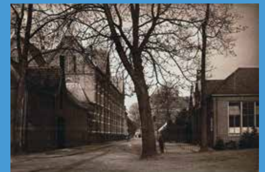
Rijkskweekschool, rechts op de ansichtkaart. Uitgeverij J.H. Schaefer, foto van Jan Willem van Wentzel. Archief Eemland.

Amersfoorters in de lagere schoolleeftijd vertellen over een bijzondere gebeurtenis in hun jonge leven: de evacuatie van de volledige bevolking van hun stad. In vergelijking met de oorlogsellende die later zou volgen was dit een bijna kleine gebeurtenis, maar zij maakte op de kinderen een grote indruk.