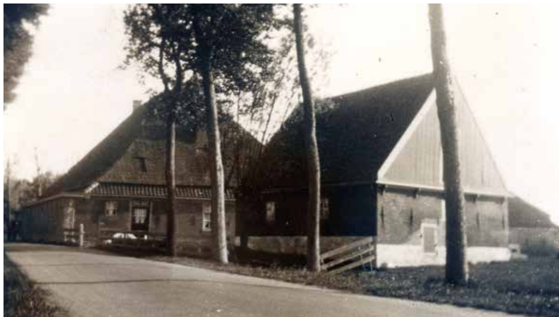
Boerderij van boer Pronk in Spanbroek.