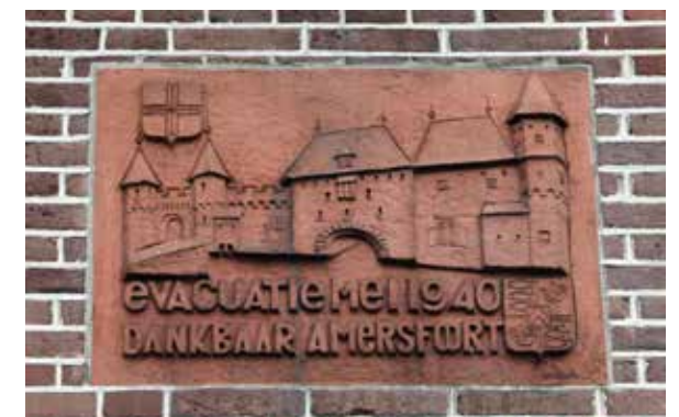
Plaquette in Warmenhuizen. 15