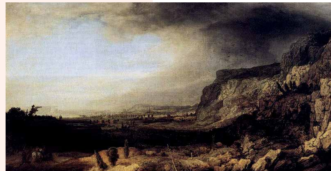
Hercules Seghers (1589/90-voor 1638), Berglandschap, ca 1633, 55 x 100 (Galleria Uffizi, Florence).

een sprookjesachtige uitstraling. Sommige werken van Boode hebben eenzelfde fantasierijke sfeer en detaillering. Hoewel Boode altijd buiten bezig was met voorbereidende tekeningen, nam hij nooit precies over wat hij zag. Hij sloeg de verschillende verschijnselen en landschappen die hij in de natuur zag op in zijn herinnering en gebruikte