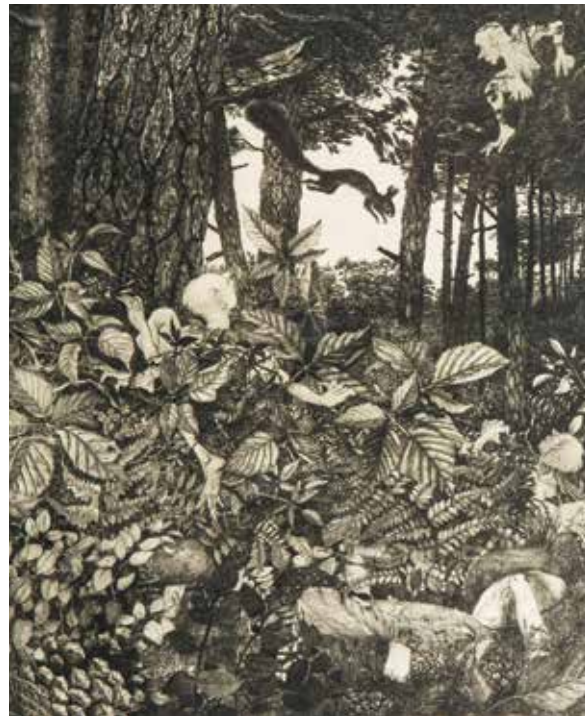
Leven in het bos.

Gedurende zijn gehele carrière, maar vooral in zijn jongere jaren, schreven kunstcritici over het lijnwerk of de tekentechniek van Boode, als bewijs dat hij autodidact was. 27 Hij werd dan ook vaak aangeduid als 'dilettant'. Zijn inzet werd altijd