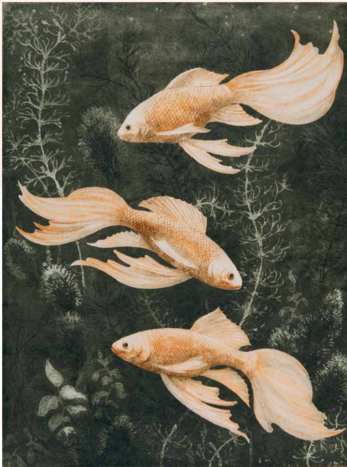
Vissen; een prachtig voorbeeld van een experiment met kleur.