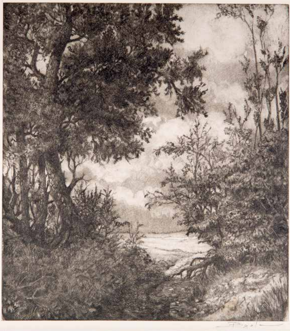
Een voorbeeld van het gebruik van tussentinten.

sterke contouren. De techniek kreeg veel kritiek; zo kon iedereen een toonbare prent maken. 4 Het zachte materiaal leende zich tot het snijden van vloeiende lijnen. Nog een kritiekpunt was het feit dat foutjes niet konden worden hersteld, waardoor er niet op een vrije manier mee te werken was. 5 Ook was het nauwelijks mogelijk om veel