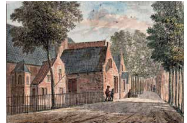
Binnenplaats van logement De Doelen waar in 1794 officieren ingekwartierd zijn geweest.

Een andere cavalerie-eenheid, de Huzaren van York, wordt gesplitst. De manschappen en