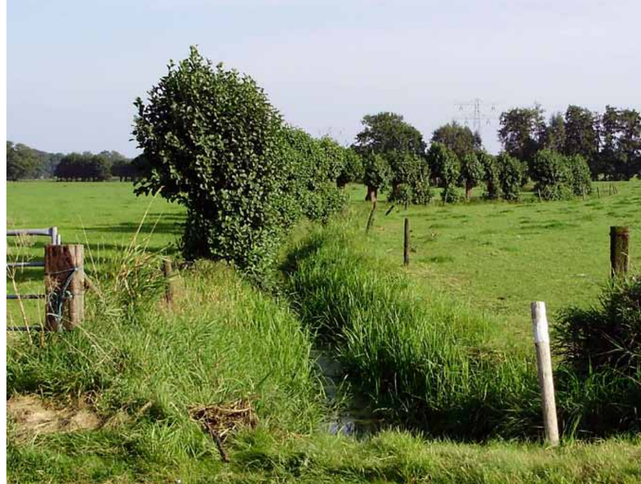
Het Zwartewater bij de kruising met de Rottegatsteeg in Maarsbergen, 2011.

Het ligt voor de hand dat de proost van Maarsbergen in 1370 een watergang heeft laten aanleggen om het water van zijn landen af te voeren naar de nieuwe heul die hij van de heer van Woudenberg mocht leggen in de Monnikendijk naar de Zeesloot. Deze watergang wordt niet in de oorkonde vermeld, omdat de aanleg een zuiver Maarsbergse aangelegenheid betrof, waar de heer van Woudenberg, die de oorkonde uitgaf, geen bemoeienis mee had. Er zijn geen bronnen waaruit de aanleg van de watergang blijkt, maar uit onderzoek ter plaatse en bestudering van oude kaarten kan worden afgeleid dat hij langs de Rottegatsteeg moet hebben gelopen. De kaarten van Maarsbergen en Woudenberg van 1716 en 1717 tonen dat deze weg begint op de overgang van Heuvelrug naar de Vallei. Verder loopt het tracé midden door het lage deel van Maarsbergen naar het noorden tot aan de boerderij Lammersdam op de grens met Rumelaar. De afvoerwatergang kan in 1370 alleen ten noorden van het Zwartewater hebben gelopen, want hij mocht geen verbinding met dat water hebben. Gezien de helling in het terrein zou er anders water vanuit het Zwartewater door de