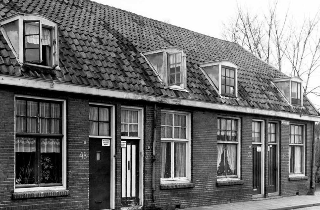
Walikerstraat 54, laatste onbewoonbaar verklaarde woning rechts, voor de sloop in 1967.