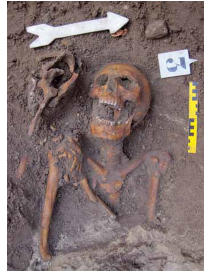
Een skelet in de Windsteeg.

In oktober 2011 heeft een kort, maar interessant, onderzoek plaatsgevonden in de Windsteeg, op de locatie waarheen de urilift – die eerst op de