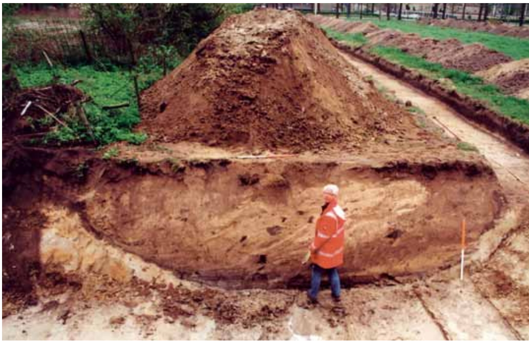
Dwarsdoorsnede van de gracht uit WO II bij de Hogeweg (op de achtergrond).