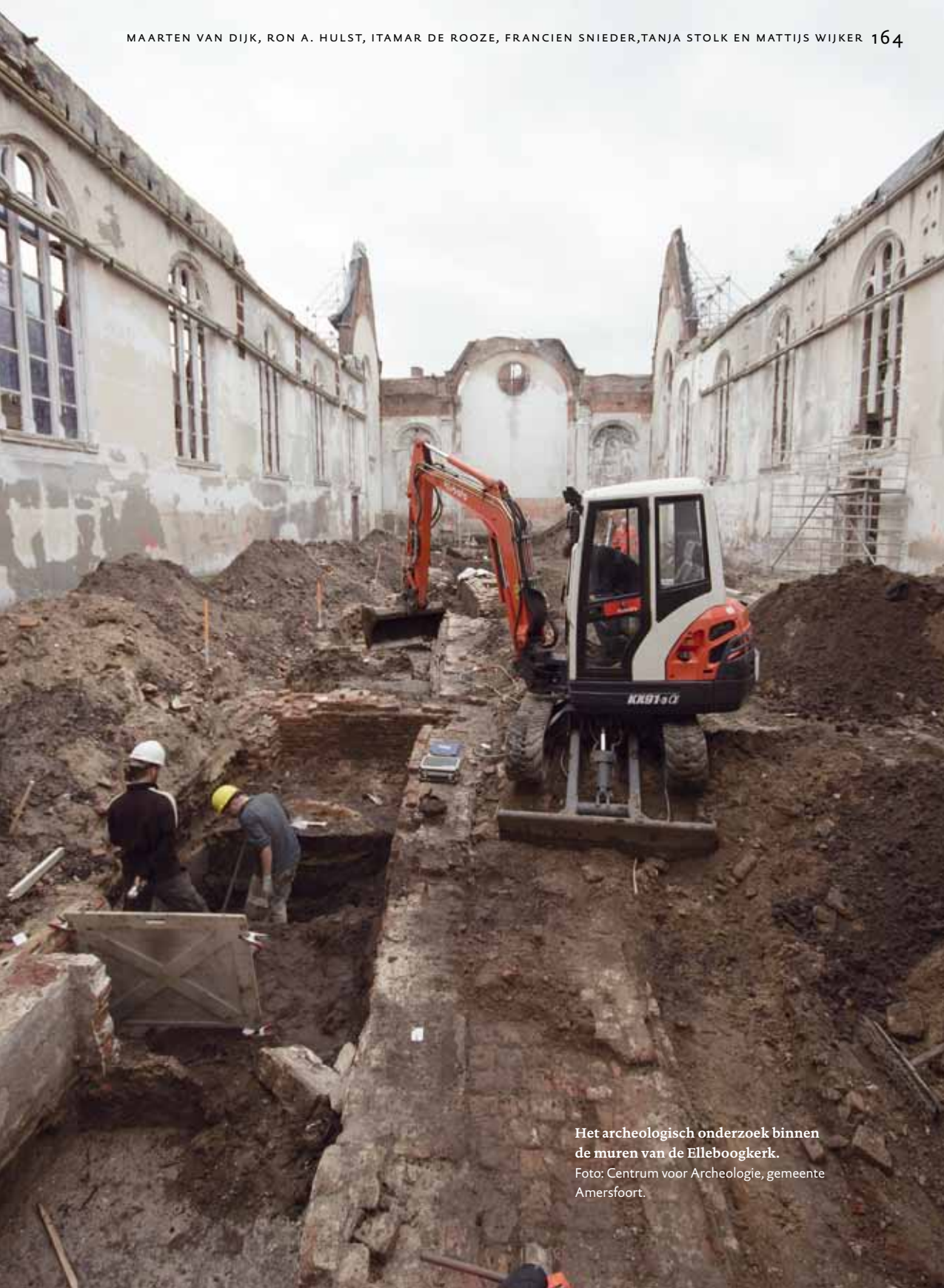
Het archeologisch onderzoek binnen de muren van de Elleboogkerk.

helaas kon niet met zekerheid worden of deze een landelijk dan wel een stedelijk karakter had. Met andere woorden: waren het boerderijen of kleine houten huizen van handelaren of ambachtslieden?