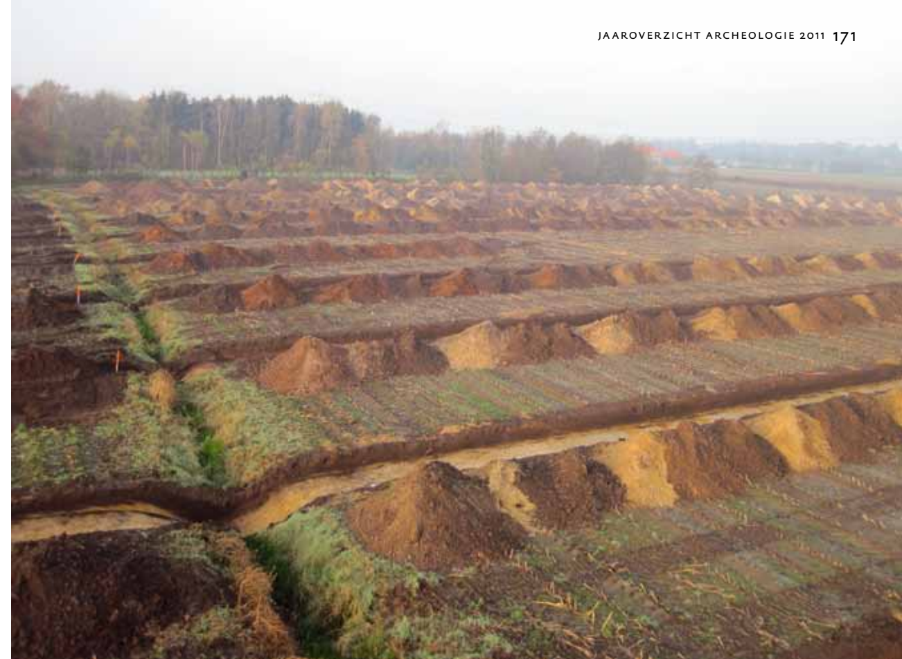
Overzicht van de proefsleuven op het terrein van de geplande golfbaan ten westen van de Bunschoterstraat.

In het noordoosten van het onderzoeksterrein zijn karrensporen aangetroffen. Ze hebben een onderlinge afstand (asbreedte) die varieerde tussen de 1,50 en 1,70 m. De sporen hebben een