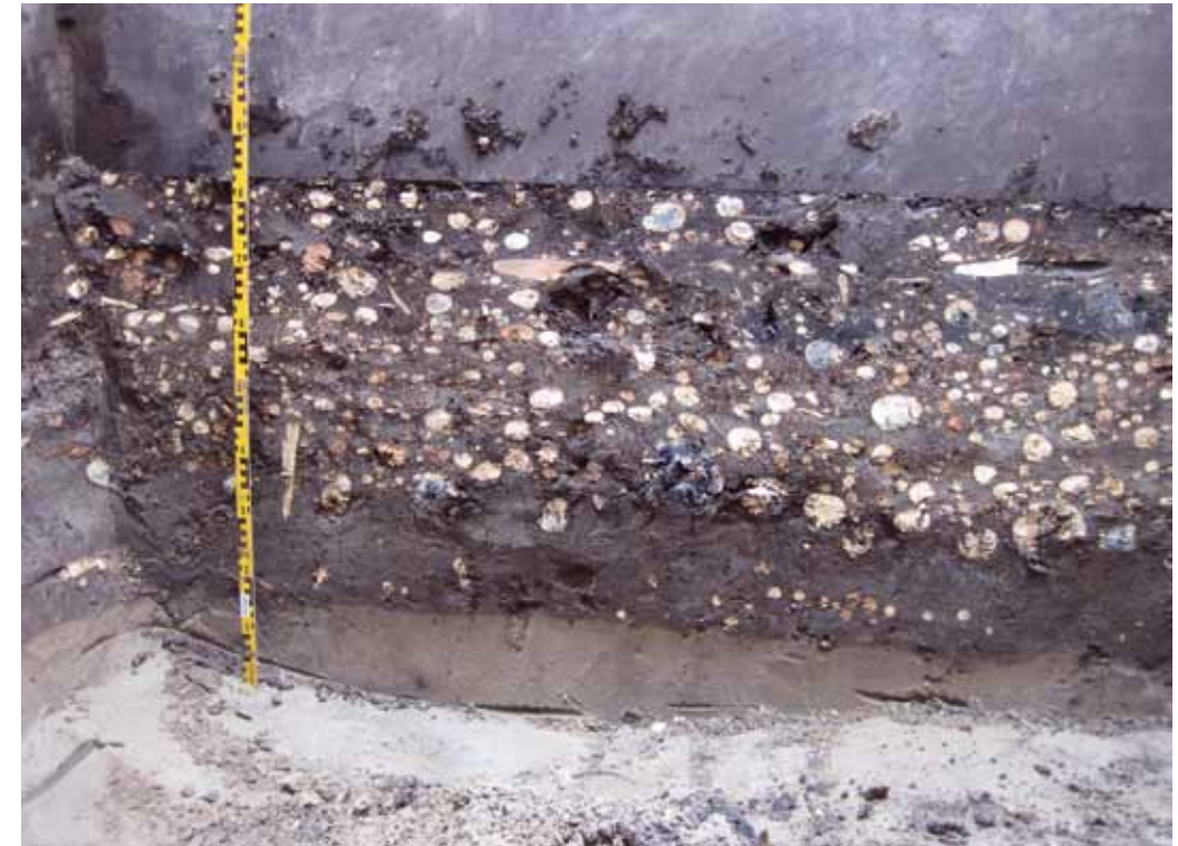
Een doorsnede door het middeleeuwse wegdek van dunne boomstammetjes.