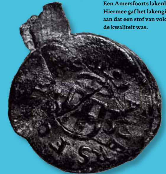
Een Amersfoorts lakenlood. Hiermee gaf het lakengilde aan dat een stof van voldoende kwaliteit was.

Met ups and downs kwam de lakennijverheid in Leiden in de 15 e eeuw tot bloei. Een strikte controle stond garant voor een kwaliteitsproduct. Alleen de kwalitatief superieure Engelse wol mocht worden verwerkt. Geen wol van elders, zoals uit Castilië of Schotland. In de loop van de 16 e eeuw (globaal vanaf 1520-1530) kwam hier de klad in. Oorzaak was onder meer de concurrentie uit Engeland, waar nu zelf de wol werd verwerkt tot laken. Dit leidde tot het verlies van afzetmarkten voor het Leidse laken. Daarbij kwam nog dat oorlogshandelingen ervoor zorgden dat de stapelmarkt voor wol in Calais, waar de Engelse wol werd verhandeld, soms moeilijk was te bereiken. Ook veranderde de smaak van de afnemers. De dikke lakense stof werd meer en meer vervangen door goedkopere dünnere saaien kamgarens van in Vlaanderen geweven Castiliaanse wol. 1 Noodgedwongen werd de verwerking van deze wol in 1520 in Leiden toegestaan. Hoewel handelshuizen werden gesticht en de buitennering in de omgeving werd bestreden, negeerden het stadsbestuur