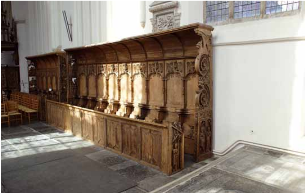
Koorgestoelte in de Martinikerk in Bolsward.