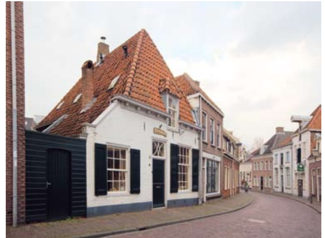
De Bloemendalsestraat met links op de voorgrond stadboerderij Bloemendalsestraat nr.44.

zoals die gold voor de middeleeuwen, duurde ook in latere eeuwen voort. Dit tonen de stadsplattegronden uit de 16 e en 17 e eeuw. Kijken we naar de kaarten van Jacob van Deventer (circa 1560), Braun en Hogenberg (1588), Janssonius (voor 1649 gemaakt) en die van Blaeu (1649) dan valt op dat dit gebied, buiten de bebouwing langs de doorgaande wegen als Kamp, Utrechtsestraat en Arnhemsestraat, uitgesproken leeg is. Wat hier wel is afgebeeld, zijn boomgaarden, moestuinen en héél veel hooibergen. De aanwezigheid hiervan laat zich in samenhang met veel runderen in en om Amersfoort goed verklaren: de hooibergen vormden de voedselvoorziening voor