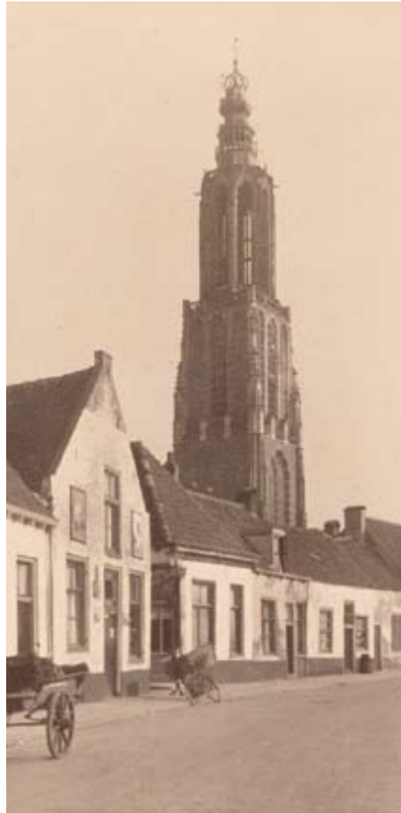
Foto uit circa 1930 tot 1938 van de Hellestraat met de Onze Lieve Vrouwetoren.

De verstedelijking is in Amersfoort heel traag verlopen, heel lang heeft de agrarische situatie voortgeduurd, met name in het gebied tussen de eerste en de tweede stadsmuur in. Het hier vrijwel ontbreken van beerputten is al veelzeggend: er waren stallen om de fecaliën te deponeren en voor afval was er de mestvaalt. Omwallingen zijn in veel middeleeuwse steden vaak zeer ruim om boerderijen en agrarische activiteiten binnen de bescherming van de muur te brengen en in Amersfoort was dat ook zo. In Amersfoort lijkt de tweede stadsmuur aanvankelijk zelfs geheel ten dienste van de landbouw en veeteelt te hebben gestaan. Als we de archeologische gegevens en de hierboven geschetste historische en cartografische gegevens met elkaar verbinden, krijgen deze een betekenis en verschaffen ze een