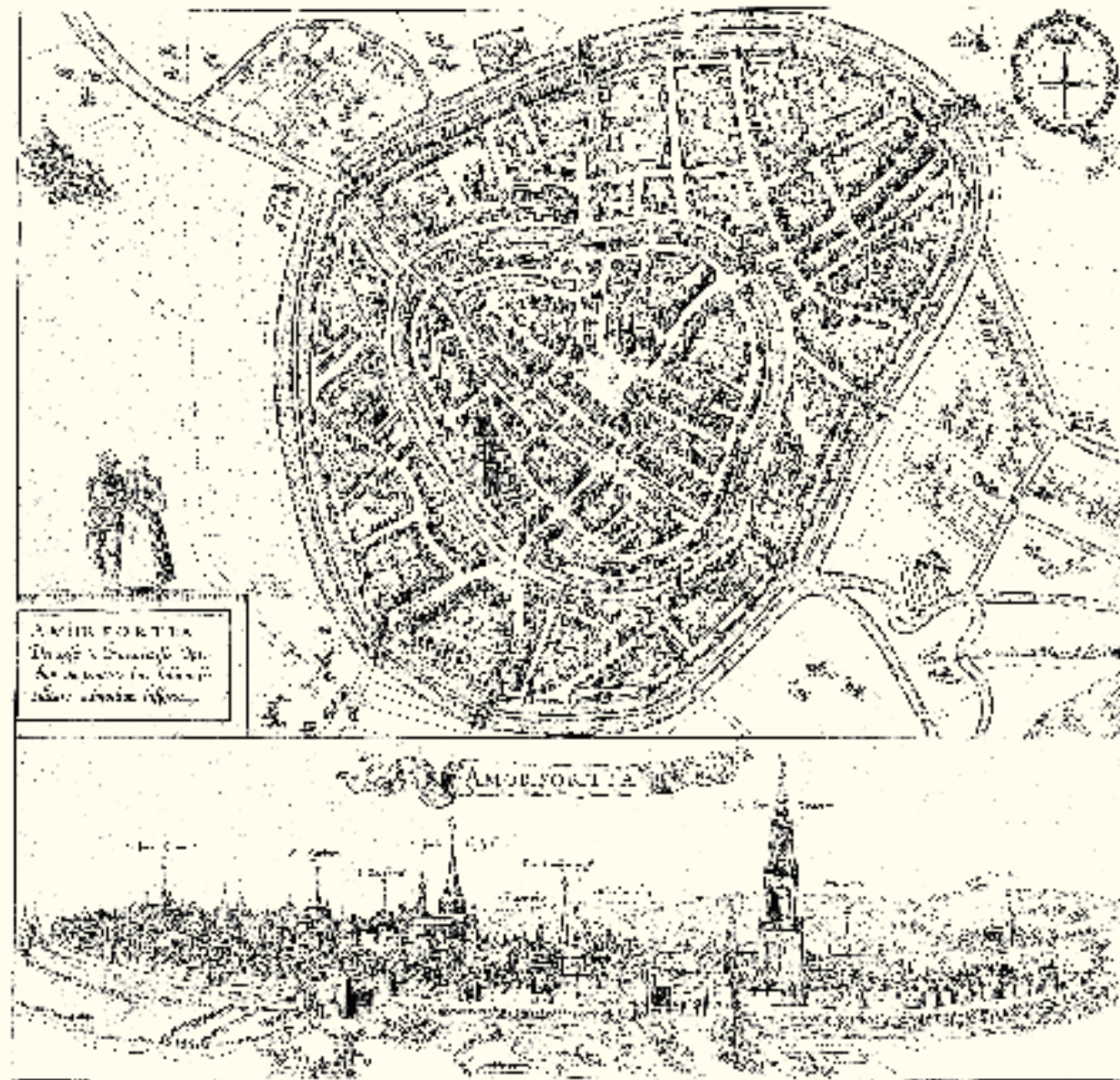
De plattegrond en stadsgezicht van Amersfoort door Braun en Hogenberg uit 1588. De tweede stadsmuur is gedetailleerd weergegeven met alle poorten en muurtorens en op het stadsgezicht zelfs de arkeltorens.