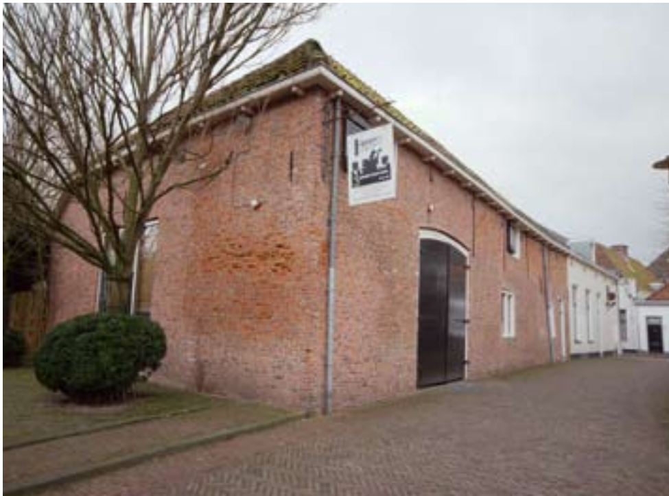
Recente foto van de zijgevel van stadboerderij Bloemendalsestraat nr.61.