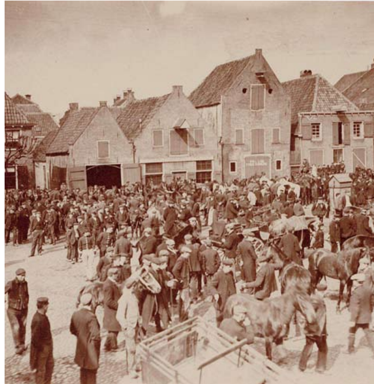
Foto uit ca. 1900 van de Beestenmarkt (paardenmarkt), tegenwoordig Achter de Kamp.