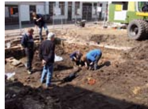
Opgraving van een boerderij aan de Valkestraat. Het skelet van een rund wordt vrijgelegd.

De stadsrechtverlening door bisschop Hendrik van Vianden in 1259 was een bevestiging van al oudere stedelijke rechten, waaronder waarschijnlijk het marktrecht. 9 Een stadsbestuur nam de leiding over van de bisschoppelijke voogd en omstreeks de tijd van de officiële stadsrechtverlening begon men met de bouw van de stadsmuur. Hierbij verzezen de poorten het eerst en vervolgens de muur zelf met daarvoor een dubbele gracht, die voor een deel door de natuurlijke loop van de Eem werd bepaald. Archeologisch onderzoek op de Hof heeft aangetoond dat dit centrale plein in de stad al in de loop van de 13 e eeuw in een keer met een dik pakket grond is opgehoogd, dus als één geheel werd gezien. Toen was de Hof in ieder geval reeds als marktplein in gebruik, maar misschien zelfs eerder. Vanaf rond 1300 was een drenkplaats in gebruik voor het vee dat hier op de markt werd gebracht. 10