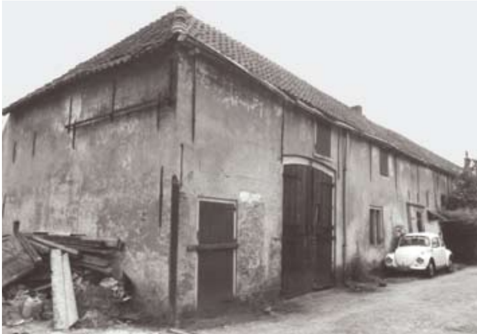
Foto uit eind jaren '70 van stadboerderij (zijgevel) Bloemendalsestraat nr.61.