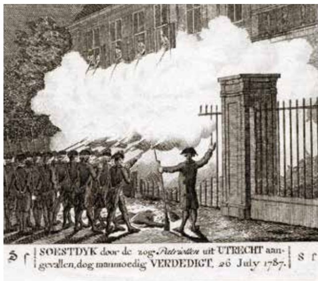
Kopergravure van de mislukte patriottische overval op het stadhouderlijke paleis in Soestdijk (26 juli 1787). Collectie Museum Flehite.