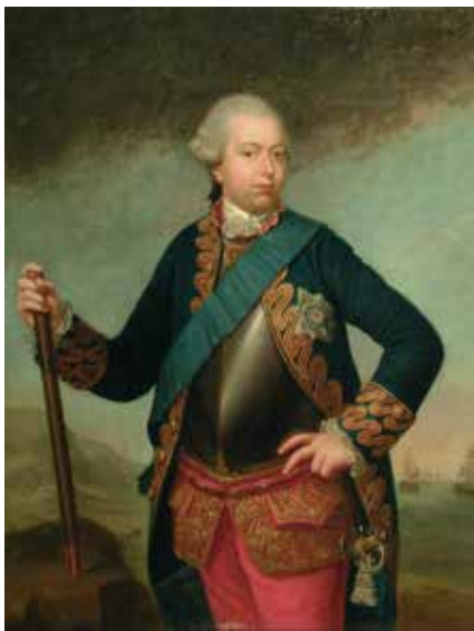
Stadhouder Willem V, schilderij van Benjamin S. Bolomey, (119x93 cm). Collectie Museum Flehite.